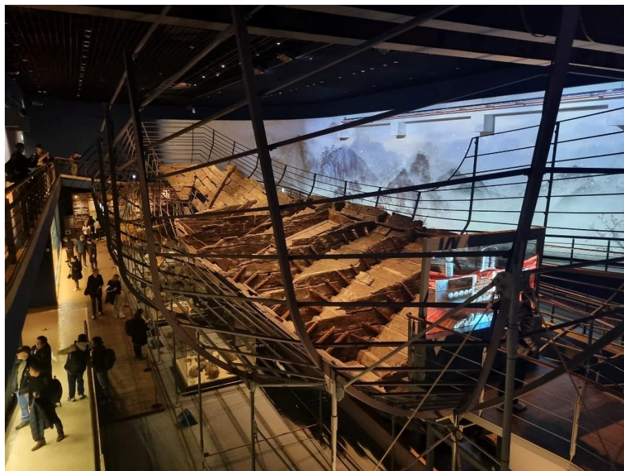
ภาพ เข้าเยี่ยมชมสถาบันการศึกษามรดกทางวัฒนธรรมใต้น้ำ

(National Research Institute of Maritime Cultural Heritage) เมืองมอโกโป สาธารณรัฐเกาหลี