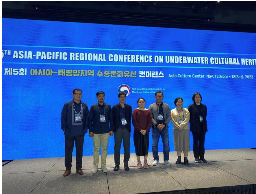
ภาพ ถ่ายภาพร่วมกับผู้นำเสนอผลงานทางวิชาการในกลุ่มที่ ๕ วันที่ ๑๔ พฤศจิกายน ๒๕๖๖