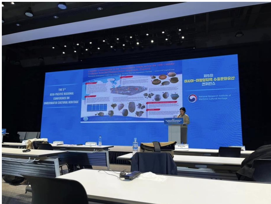
ภาพ การนำเสนอโปสเตอร์ความรู้ในกลุ่มที่ ๕ เมื่อวันที่ ๑๔ พฤศจิกายน ๒๕๖๖