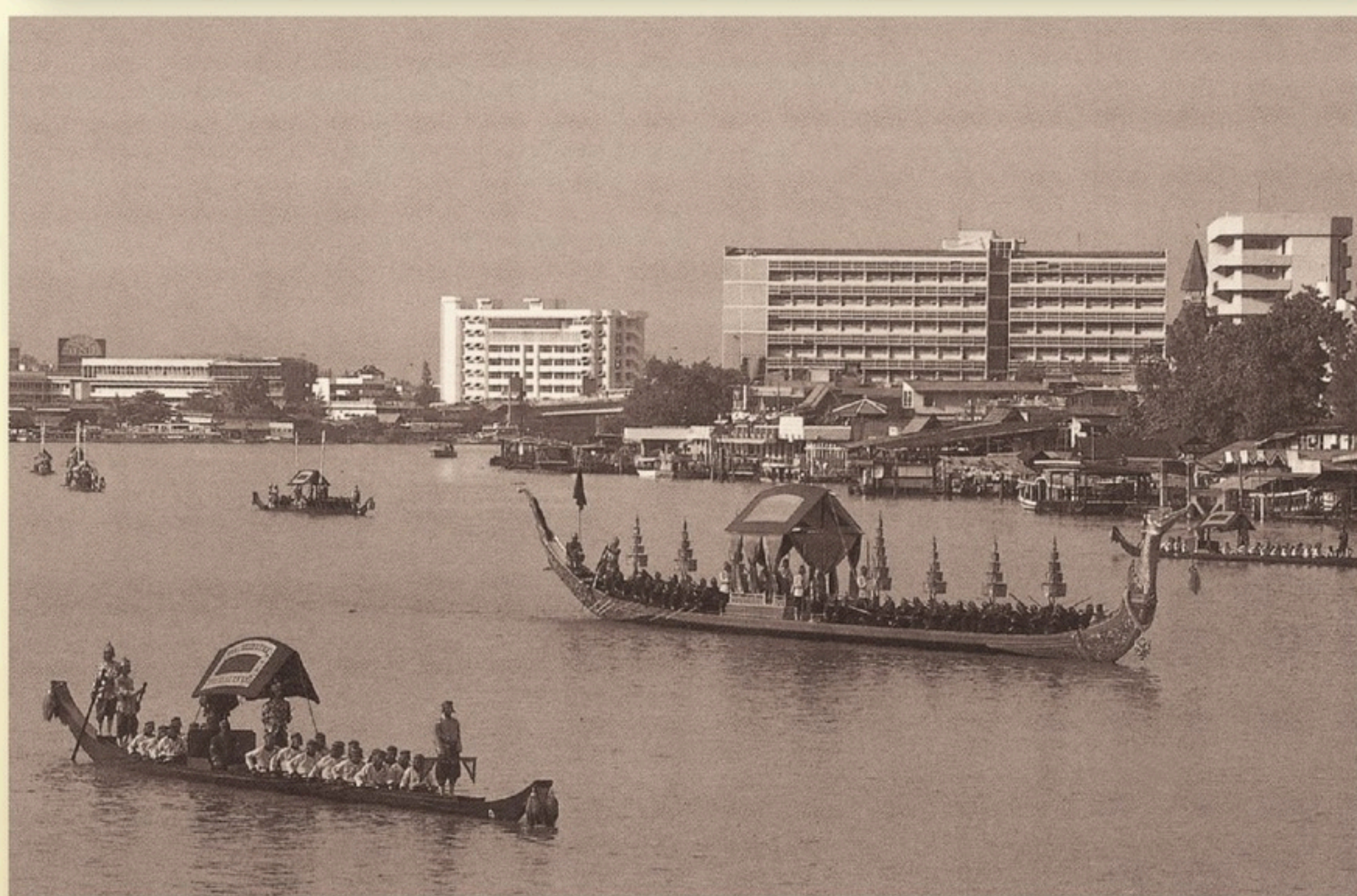
ขบวนพยุหยาตราทางชลมารค (ใหญ่) สมโภชกรุงรัตนโกสินทร์ ๒๐๐ ปี วันที่ ๕ เมษายน ๒๕๒๕