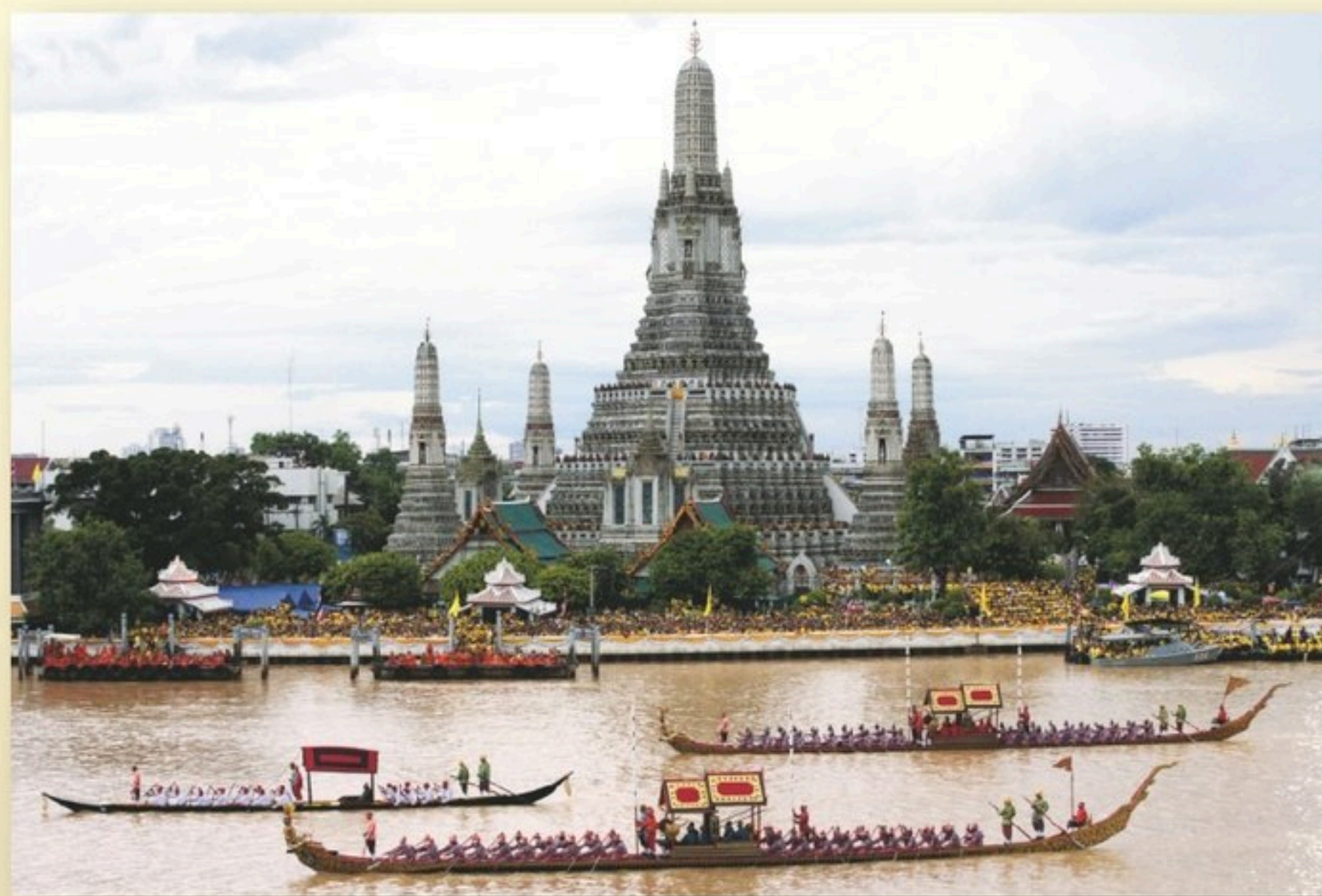
ขบวนพยุหยาตราทางชลมารค (ใหญ่) การเสด็จพระราชดำเนินถวายผ้าพระกฐิน ณ วัดอรุณราชวราราม