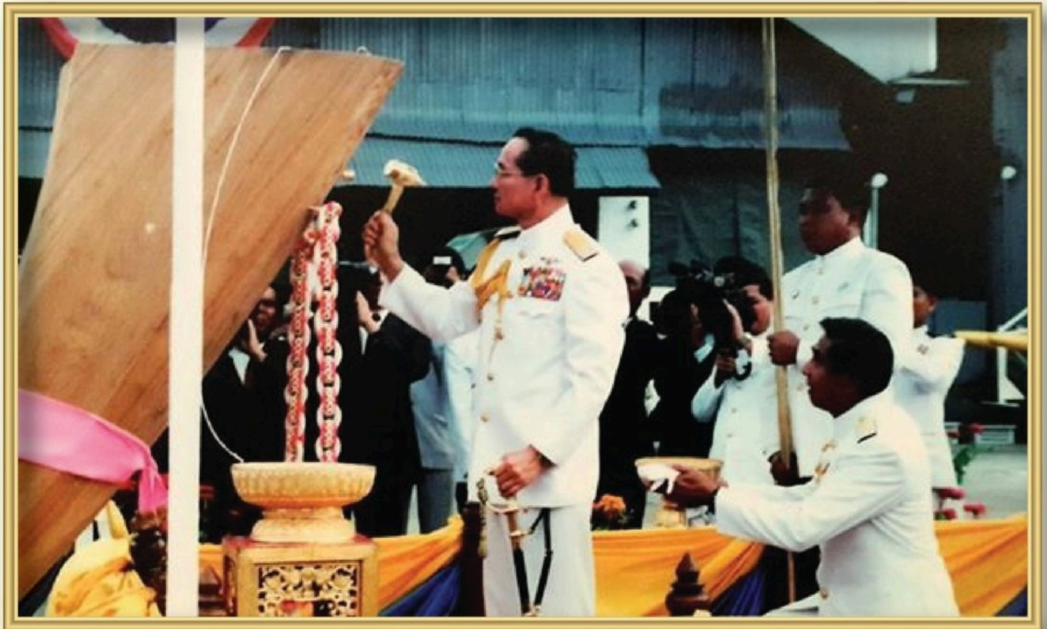
พระบาทสมเด็จพระบรมชนกาธิเบศร มหาภูมิพลอดุลยเดชมหาราช บรมนาถบพิตร ทรงประกอบพิธีวางกระดูกงูเรือพระที่นั่งนารายณ์ทรงสุบรรณ รัชกาลที่ ๙