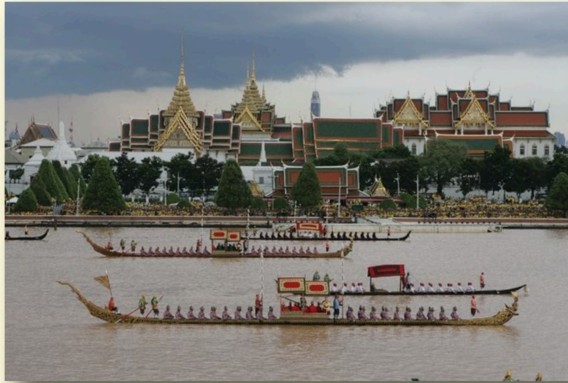
ขบวนพยุหยาตราทางชลมารค (ใหญ่) ฉลองสิริราชสมบัติครบ ๖๐ ปี เมื่อวันที่ ๑๒ มิถุนายน ๒๕๔๙

“ ประเพณีนั้นหมายถึงแบบแผนหรือขนบธรรมเนียมที่ปฏิบัติสืบต่อกันมา การสิ่งใดที่ริเริ่มขึ้นแล้วได้รับความนิยมถือปฏิบัติตามกันต่อไป จัดว่าเป็นประเพณี คนเราจะดำเนินชีวิตก็ต้องมีแบบแผนเป็นหลัก เราจึงต้องมีประเพณีเป็นแนวปฏิบัติ ชาดไทยเราได้มีประเพณีที่ดั่งงามมาแต่โบราณกาล บรรพบุรุษของเราได้ปฏิบัติสืบเนื่องมาหลายชั่วคน เมื่อตกทอดมาถึงเราเช่นนี้ เราควรจะรับไว้ด้วยความเคารพ...”