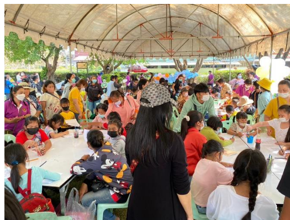
กิจกรรมวาดภาพระบายสี ณ เต็นท์ข้างเวที