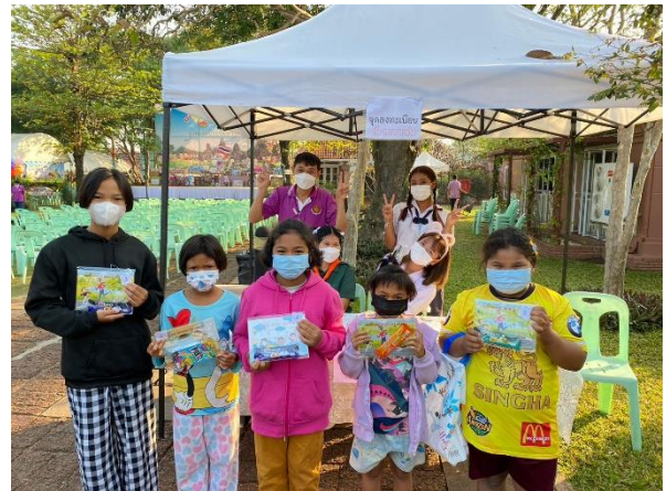
การลงทะเบียน เด็กและเยาวชน กิจกรรมจับฉลากลุ้นรับของรางวัล