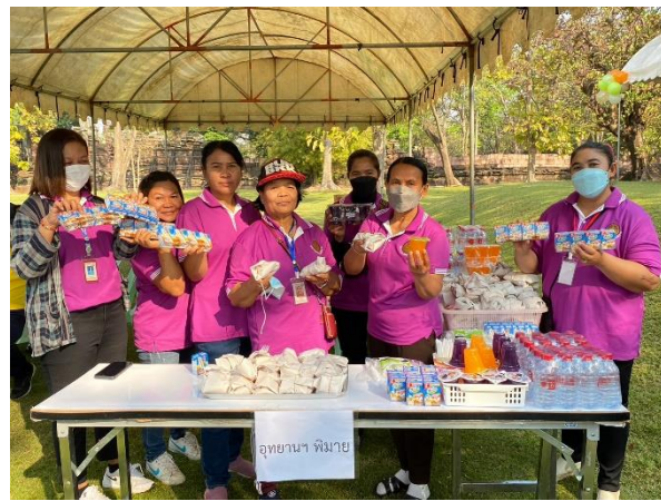
การแจกอาหาร ขนม และเครื่องดื่ม