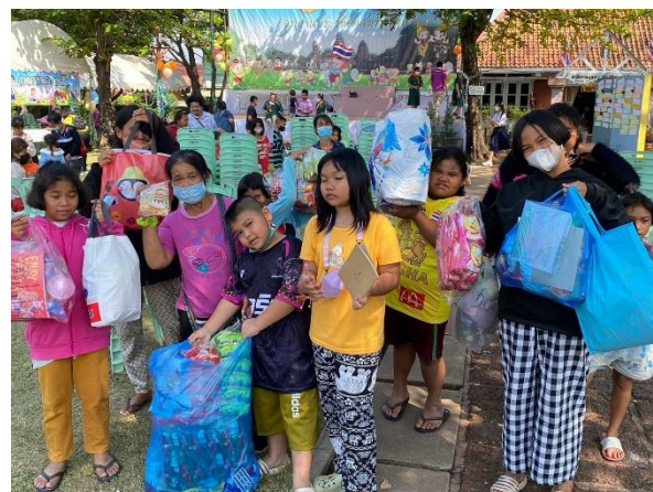
บรรยากาศ ความสุข สนุกสนาน สาระความรู้ และรับของรางวัลมากมาย ณ อุทยานประวัติศาสตร์พิมาย