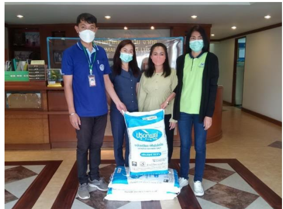
ขอขอบคุณผู้ใหญ่ใจดี ร่วมให้การสนับสนุนทุนการศึกษา ขนม ของเล่น และของรางวัลสำหรับเด็กและเยาวชน