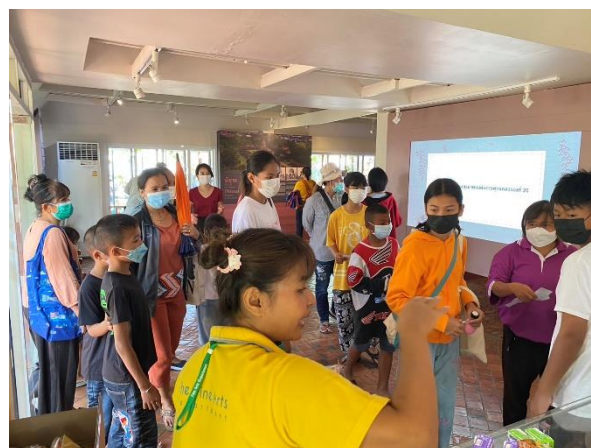
กิจกรรม เติมคำนำโชค คำศัพท์เกี่ยวกับโบราณสถาน ภาษาไทย และภาษาอังกฤษ ณ ศูนย์บริการข้อมูล