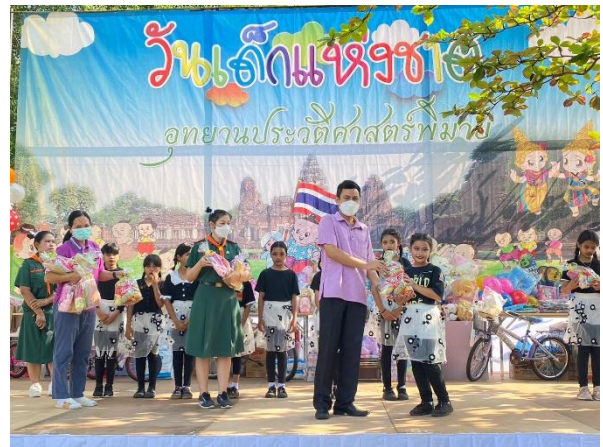
กิจกรรม การแสดงบนเวที จากนักเรียนโรงเรียนต่าง ๆ