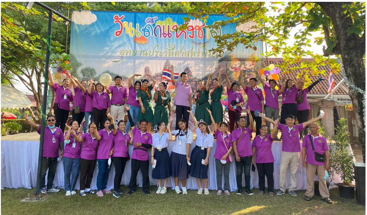
เจ้าหน้าที่อุทยานประวัติศาสตร์พิมาย เตรียมความพร้อมในการจัดกิจกรรม