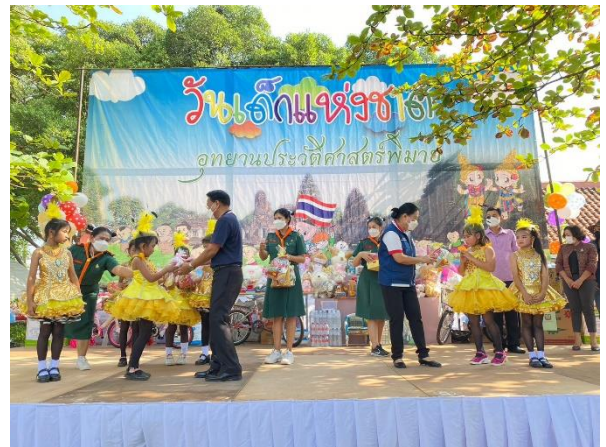
กิจกรรม การแสดงบนเวที จากนักเรียนโรงเรียนต่าง ๆ