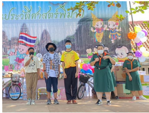
กิจกรรม การนำเสนอองค์ความรู้จากการระบายสี และมัคคุเทศก์น้อยภาษาอังกฤษ