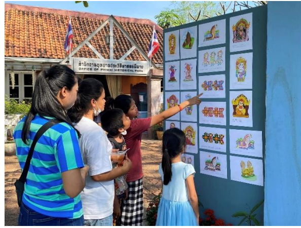
กิจกรรมการส่งเสริมให้เด็กและเยาวชน กล้าคิด กล้าทำ กล้าแสดงออก