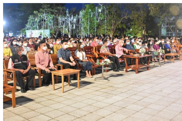
บรรยากาศช่วงพิธีเปิดโครงการสังคีตวัฒนธรรม