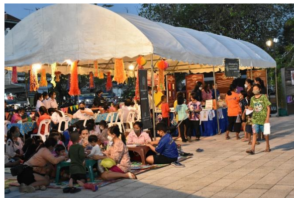
การจัดนิทรรศการและเดินท์กิจกรรมสำหรับเยาวชน โดย พิพิธภัณฑ์สถานแห่งชาติพิมาย