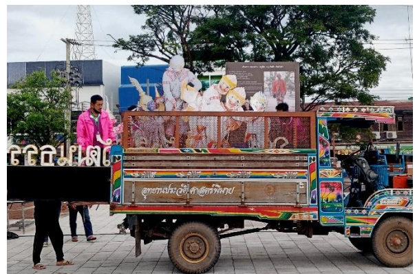
การเตรียมงานและประชาสัมพันธ์โครงการ