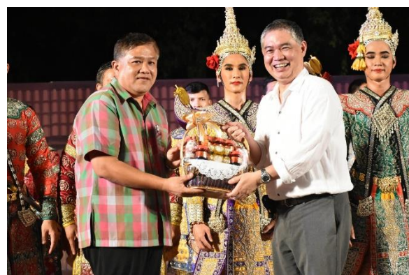
ประธานและแขกผู้มีเกียรติมอบช่อดอกไม้และของที่ระลึกแก่ผู้จัดการแสดง