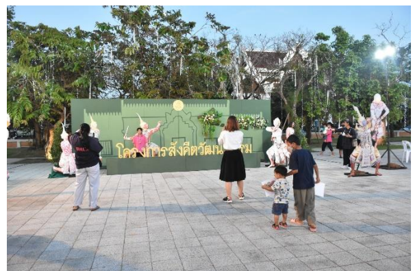
แขกผู้มีเกียรติและนักท่องเที่ยวถ่ายภาพ ณ จุดเช็คอินเป็นที่ระลึก