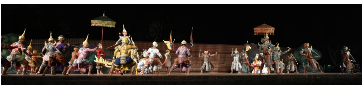
การแสดงโขน รามเกียรติ์ ชุดศึกโรมคัล ทศกัณฐ์พ่าย โดยสำนักการสังคีต กรมศิลปากร