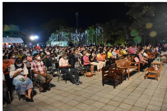
บรรยากาศผู้เข้าชมการแสดงโขน โครงการสังคีตวัฒนธรรม