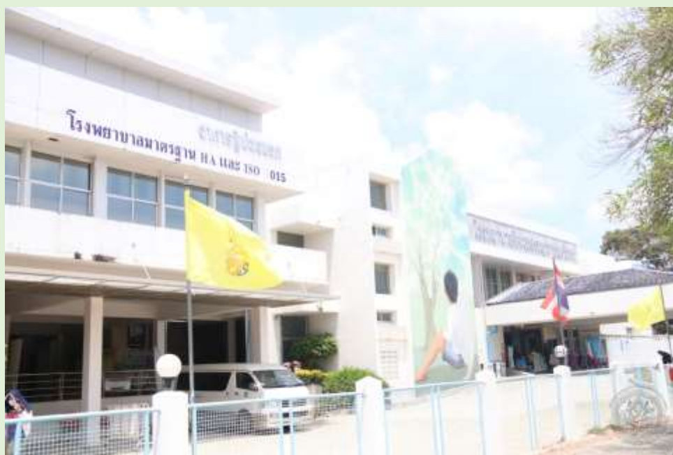
อาคารโรงพยาบาลในปัจจุบัน