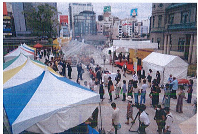
รูปที่ ๓ (ซ้าย) นายโสรัจ สุขถาวร กงสุลใหญ่ ณ เมืองฟูกูโอกะ นำปลัดกระทรวงวัฒนธรรมชมงานเทศกาลไทยฯ (ขวา) บรรยากาศภายในงานเทศกาลไทยฯ