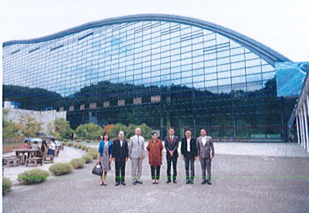
รูปที่ ๖ คณะผู้บริหารกระทรวงวัฒนธรรมหรือการจัดการและจัดแสดงนิทรรศการ รวมทั้งเข้าพบหารือกับ คณะผู้บริหารของพิพิธภัณฑ์สถานแห่งชาติคิวชู