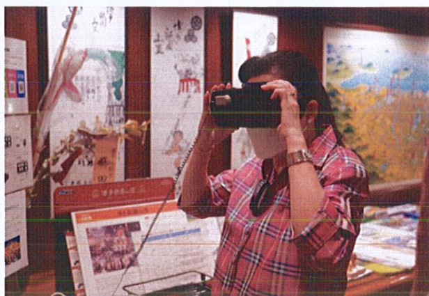
รูปที่ ๗ คณะผู้บริหารกระทรวงวัฒนธรรมเข้าเยี่ยมชมแหล่งเรียนรู้ย่านเมืองเก่าฮากาตะ