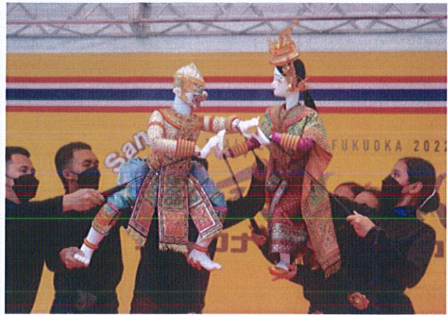
รูปที่ ๒ (ซ้าย) การแสดงดนตรีไทยร่วมสมัยจากคณะนักแสดงกรมศิลปากร และ (ขวา) การแสดงหุ่นละครเล็ก จากคณะนักแสดงนาฏยศาลาหุ่นละครเล็ก (โจหลุยส์)

การจัดงานเทศกาลไทย ณ เมืองฟูกูโอกะ ประจำปี ๒๕๖๕ ระหว่างวันที่ ๒๖ - ๒๘ สิงหาคม ๒๕๖๕ ในครั้งนี้ นับว่าเป็นโอกาสอันดีในการเผยแพร่และประชาสัมพันธ์ประเทศไทยสู่สายตาชาวต่างชาติ รวมถึงเป็นการผลักดัน “Soft Power” ความเป็นไทย เพื่อเพิ่มมูลค่าเศรษฐกิจ สร้างรายได้และภาพลักษณ์ที่ดีให้แก่ประเทศ โดยเฉพาะ อุตสาหกรรมวัฒนธรรมสร้างสรรค์ที่มีศักยภาพ 5F ได้แก่ อาหาร (Food) ภาพยนตร์และวีดิทัศน์ (Film) ผ้าไทยและการออกแบบแฟชั่น (Fashion) มวยไทย (Fighting) และเทศกาลประเพณี (Festival) สู่ระดับโลก โดยตลอดระยะเวลา ๓ วัน ของการจัดงานเทศกาลไทยฯ มีการตอบรับที่ดีจากผู้ร่วมงานทั้งชาวไทยและชาวต่างชาติรวมกว่า ๑๒,๐๐๐ คน โดยเฉพาะ การแสดงทางวัฒนธรรมไทยจากกระทรวงวัฒนธรรมซึ่งได้สร้างคุณค่าและบรรยากาศความเป็นไทย อันจะเป็นการส่งเสริม ภาพลักษณ์ที่ดีของประเทศในอนาคตต่อไป