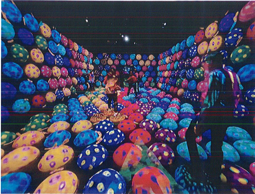
รูปที่ ๘ คณะผู้บริหารกระทรวงวัฒนธรรมเข้าร่วมแลกเปลี่ยนเรียนรู้การจัดการแสดงนิทรรศการสื่อดิจิทัล ณ พิพิธภัณฑ์ TeamLab Forest Fukuoka