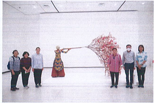
รูปที่ ๗ คณะผู้บริหารกระทรวงวัฒนธรรมหรือการบริหารงานพิพิธภัณฑ์และการจัดงาน ณ พิพิธภัณฑ์ศิลปะฟูกูโอกะ