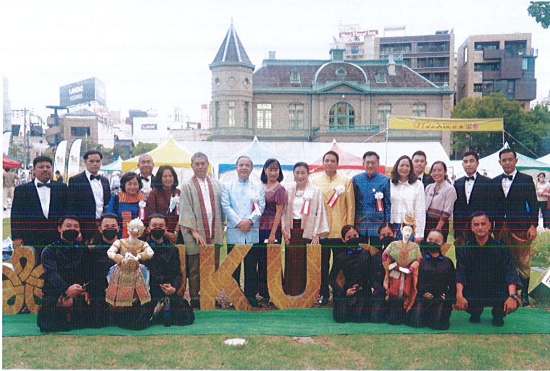
รูปที่ ๔ คณะผู้บริหารและคณะนักแสดงฝ่ายไทยที่เข้าร่วมในพิธีเปิดเทศกาลไทย ณ เมืองฟูกูโอกะ ประจำปี ๒๕๖๕ ในวันที่ ๒๖ สิงหาคม ๒๕๖๕