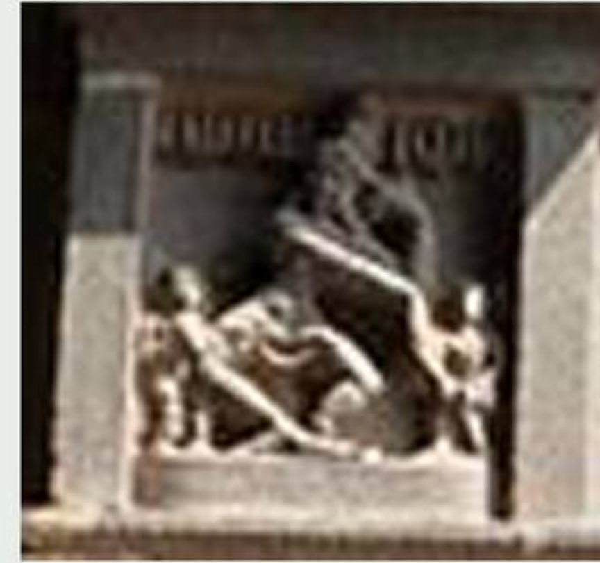
พระศิวะกำลังรำรำท่าลลิตะ