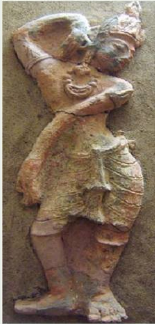
แผ่นดินเผารูปบุคคลกำลังรำรำ

พบในบริเวณเมืองโบราณอู่ทอง อำเภ่อู่ทอง จังหวัดสุพรรณบุรี