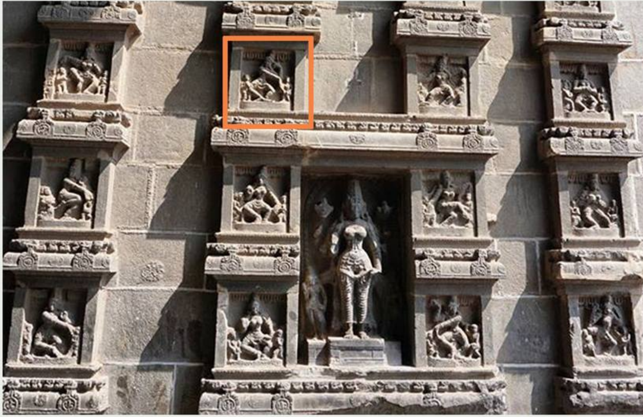
ภาพสลักศิวะนาฏราชที่เทวาลัยจิทัมพรัม ประเทศอินเดีย