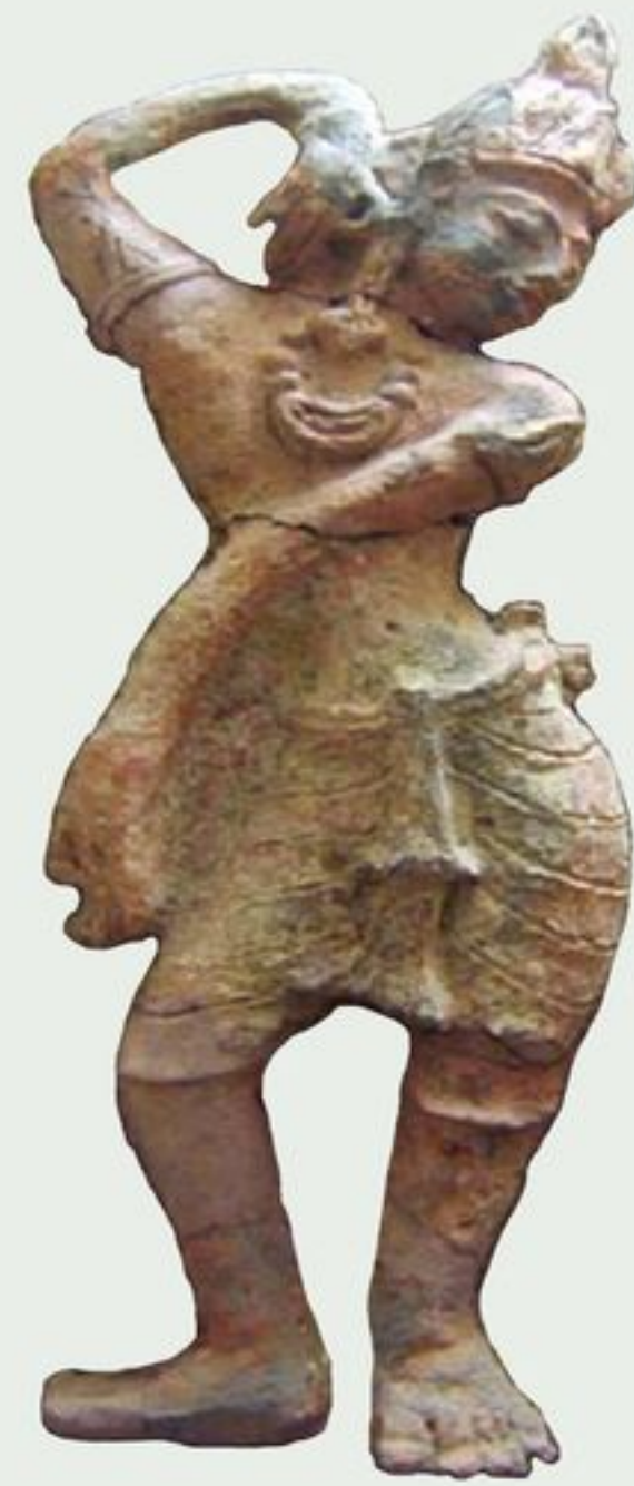
แผ่นดินเผารูปบุคคลกำลังรำ พบในบริเวณเมืองโบราณอู่ทอง อำเภออู่ทอง จังหวัดสุพรรณบุรี