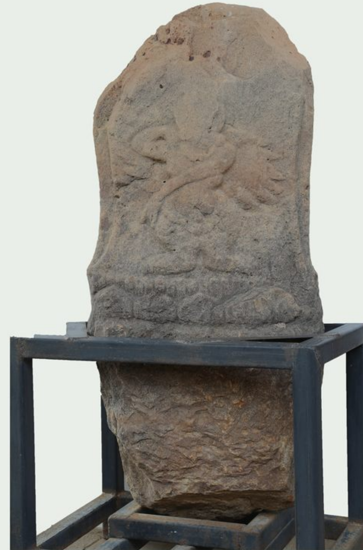
ใบเสมาสลักภาพบุคคลกำลังรำรำ ได้จากบ้านเสมา อำเภอกมลาไสย จังหวัดกาฬสินธุ์ ปัจจุบันเก็บรักษาและจัดแสดงที่อาคารใบเสมา พิพิธภัณฑสถานแห่งชาติ ขอนแก่น