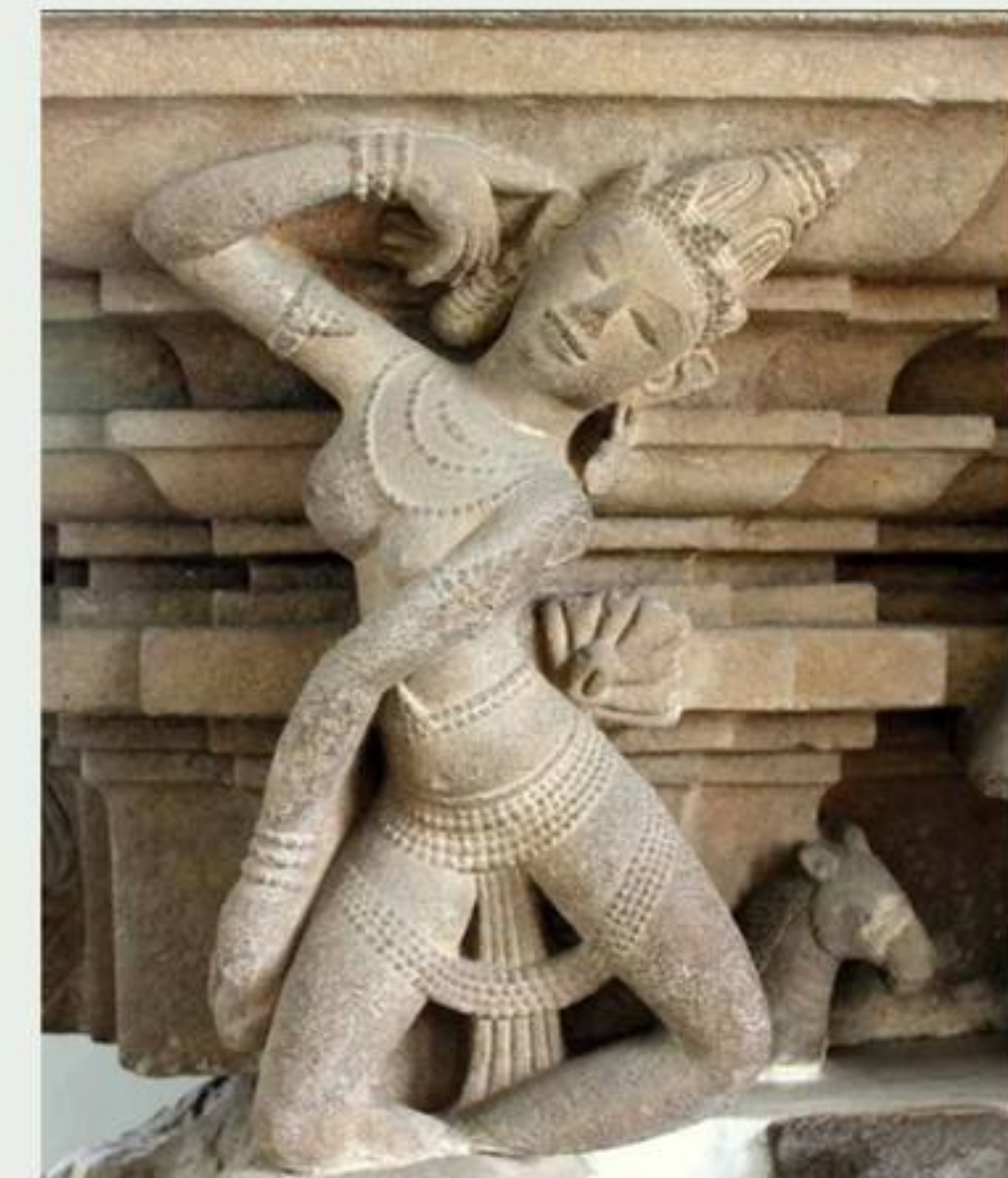
ประติมากรรมรูปสตรีกำลังรำรำ ศิลปะจาม พบที่ปราสาทตราเกี้ยว ประเทศเวียดนาม

ปราสาทตราเกี้ยวสร้างขึ้นเนื่องในลัทธิไศวนิกายหรือบูชาพระศิวะ ดังนั้น ประติมากรรมรูปสตรีองค์นี้ น่าจะมีคติในการสร้างขึ้นเพื่อการฟ้อนรำประกอบดนตรี เพื่อบูชาหรือทำพิธีกรรมให้กับเทพเจ้าที่อยู่ในปราสาท