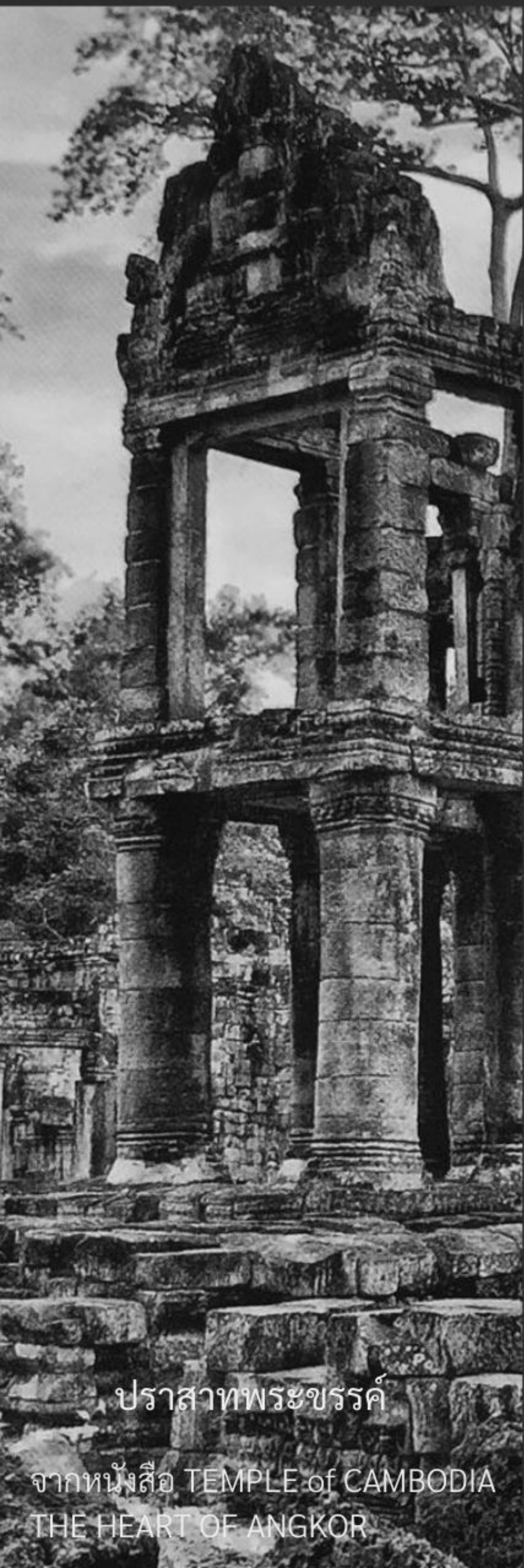
ปราสาทพระขรรค์

จากหนังสือ TEMPLE of CAMBODIA THE HEART OF ANGKOR