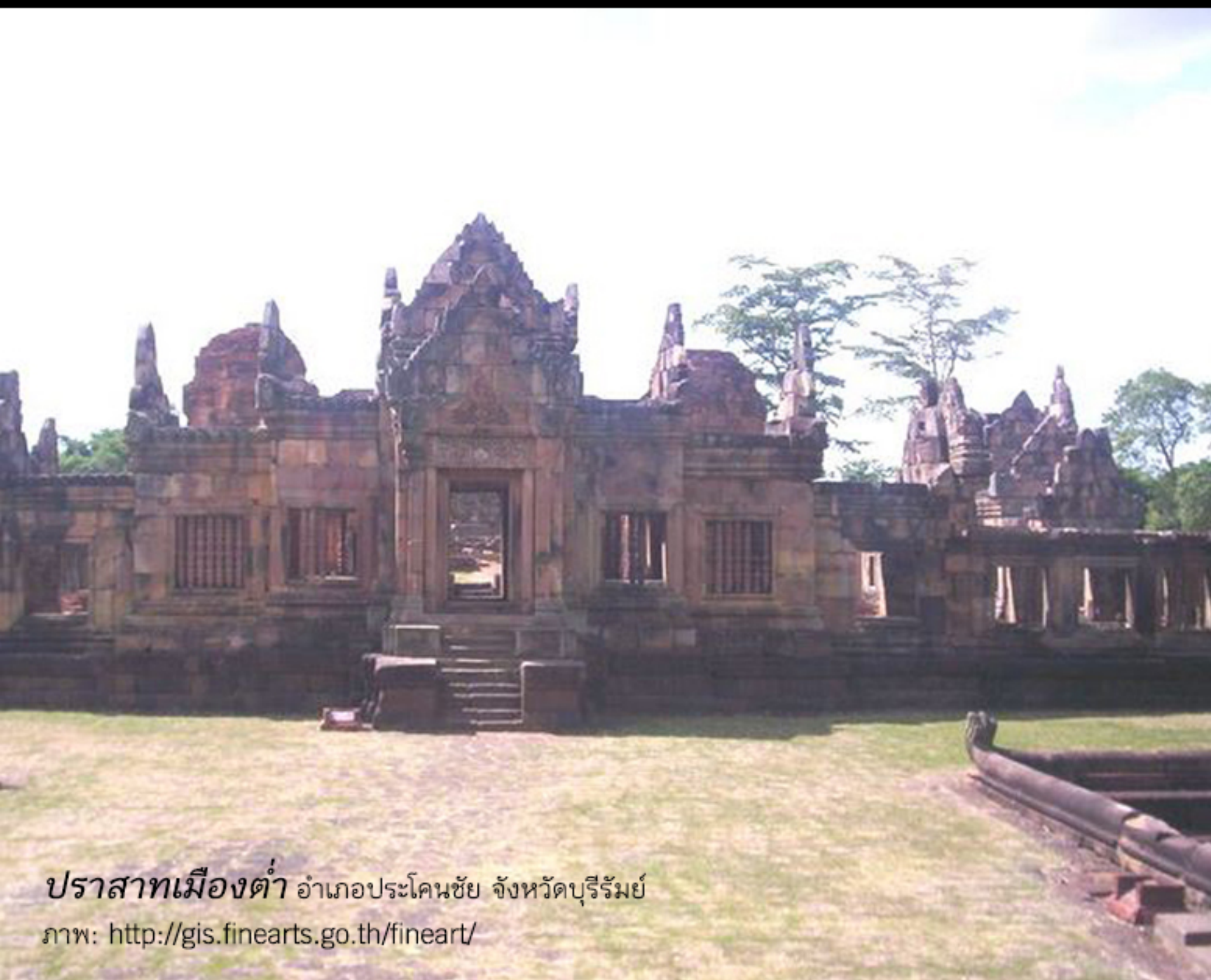
ปราสาทเมืองต่ำ อำเภอประโคนชัย จังหวัดบุรีรัมย์