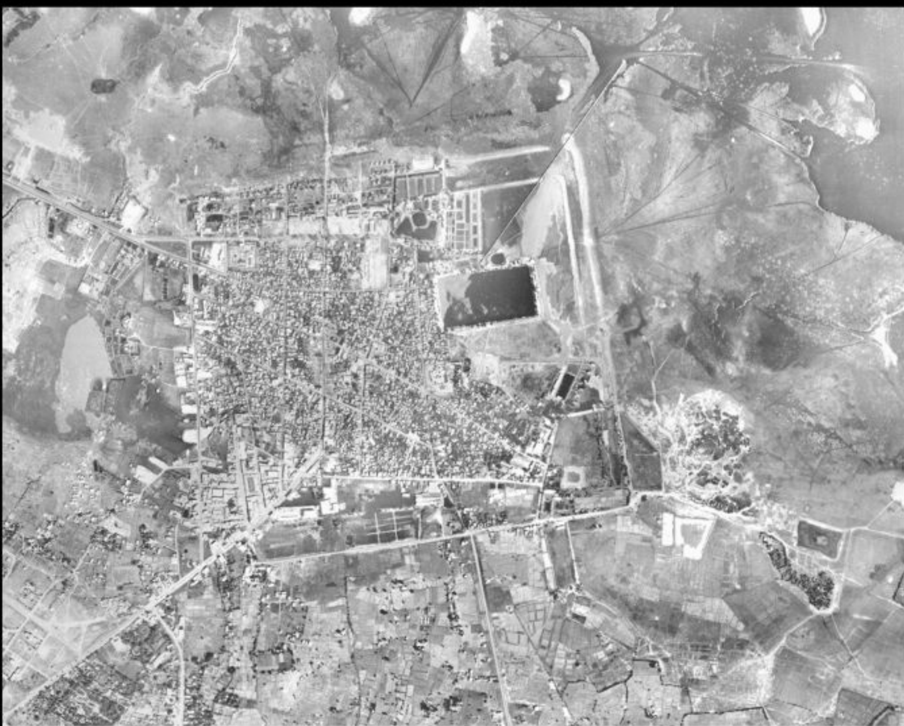
ภาพถ่ายทางอากาศ เมืองโบราณสกลนคร (พ.ศ.2516)

ขณะที่ดินแดนแถบแอ่งสกลนครที่อยู่ด้านทิศตะวันออกของเทือกเขาภูพานมีเมืองสกลนครเก่าหรือเมืองหนองหารหลวงริมฝั่งหนองหารหลวงซึ่งเป็นทะเลสาบขนาดใหญ่ที่สุดในภาคอีสาน เมืองแห่งนี้เป็นเมืองในคติวัฒนธรรมเขมรโบราณที่เจริญรุ่งเรืองเป็นอย่างมากในช่วงปลายพุทธศตวรรษที่ 16 – กลางพุทธศตวรรษที่ 17 บริเวณภายในตัวเมือง นอกเมืองและบริเวณใกล้เคียงได้สำรวจพบศาสนสถานประเภทปราสาทในคติวัฒนธรรมเขมรโบราณก่อสร้างขึ้นหลายแห่ง ที่สำคัญ เช่น เมืองสกลนครเก่า มีลักษณะแผนผังเมืองเป็นรูปสี่เหลี่ยมจัตุรัส มีคู - กำแพงเมืองล้อมรอบขนาด 1500 x 1350 เมตร ตามแบบวัฒนธรรมเขมรโบราณภายในเมือง มีโบราณสถานสำคัญคือพระธาตุเชิงชุม ซึ่งเดิมเป็นปราสาทในศิลปะเขมรโบราณ พบจารึกบริเวณวงกบกรอบประตูทางเข้า มีอายุราวพุทธศตวรรษที่ 16 - 17 กล่าวถึงกำเสตงและโฆลญพลซึ่งเป็นหัวหน้าหมู่บ้านทำการกำหนดหลักเขตที่ดินและการถวายสิ่งของแด่ศาสนสถานด้านหน้าปราสาท มีบารายขนาดใหญ่