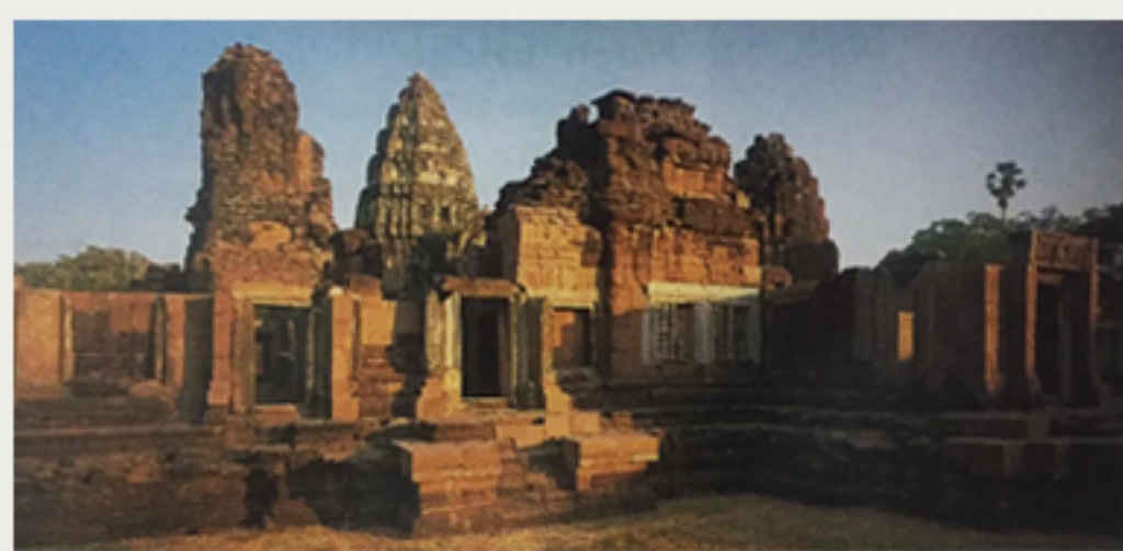
ปราสาทหินพิมาย จากหนังสือ A Guide to KHMER TEMPLES IN THAILAND & LAOS หน้า 76

และเมื่อพิจารณาถึงภูมิที่ตั้งของเมืองสกลนครเก่าที่มีภูพานเป็นปราการหลังบนยอดภูพาน มีพระธาตุภูเพ็กเป็นศาสนบรรพตเหนือยอดเขาเช่นเดียวกับปราสาทพระวิหาร มีหนองหารหลวงเป็นแหล่งน้ำใหญ่ เป็นคลังปลาอันอุดมสมบูรณ์เช่นเดียวกับทะเลสาบแห่งเมืองพระนคร ประเทศกัมพูชา ที่แวดล้อมด้วยที่ราบกว้างใหญ่อันอุดมสมบูรณ์เหมาะแก่การปลูกข้าว ทอดยาวสู่แม่น้ำโขงจนถึงฝั่ง ประเทศลาวและเวียดนามที่มีสภาพเป็นเทือกเขาสูง อุดมสมบูรณ์ด้วยพืชพันธุ์และสัตว์ป่าตลอดจนชนเผ่าพื้นเมือง ทำให้สามารถสร้างบ้านแปลงเมืองได้เป็นอย่างดี โดยเฉพาะขุนนางยศกำสแต่งที่จัดสรรที่ดินกับข้าราชการและประชาชนในเขตพระธาตุเชิงชุมนั้นก็มิอาจร่วมสมัยกับกัมสแต่งมหารัชมังมัยที่ย้าย