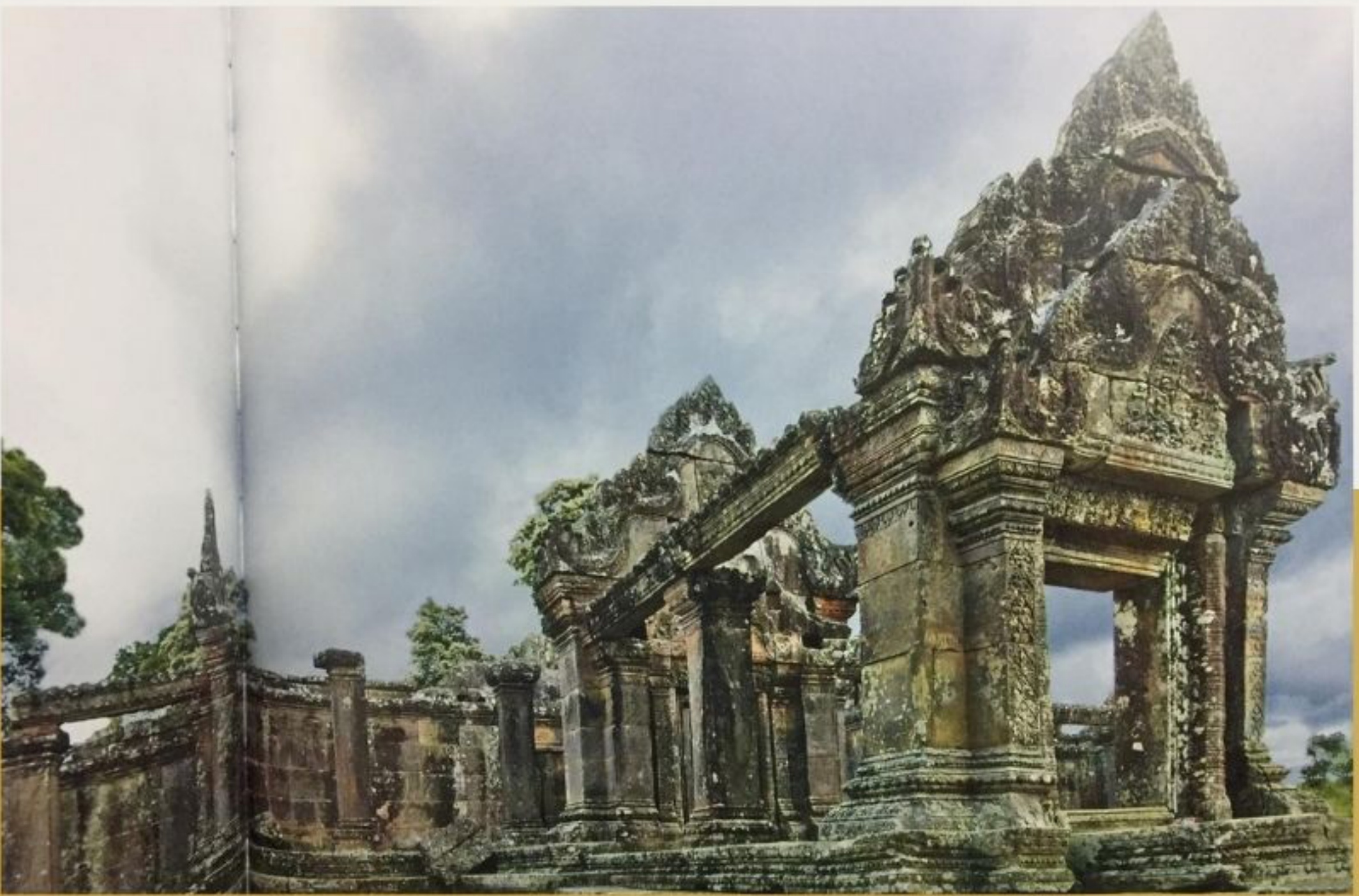
ปราสาทพระวิหาร

ด้วยเหตุนี้ จึงได้มีนักวิชาการหลายท่านสันนิษฐานว่า เมืองมหิธรปุระนี้ควรจะตั้งอยู่ในดินแดนแถบภาคอีสาน ของประเทศไทยที่สำคัญ เช่น อมรา ศรีสุชาติ กล่าวว่ เมืองมหิธรปุระน่ามีความสัมพันธ์กับปราสาทพระวิหาร โดยมีกำแพงมหิธรวรมันเจ้าเมืองวิเวทหะผู้มีหน้าที่ดูแล ปราสาทพระวิหารเป็นต้นสกุลของราชวงศ์มหิธรปุระ ต่อมาพระเจ้าสุริยวรมันที่ 1 ได้สั่งให้กำแพงมหิธรวรมันพร้อมวงศ์ญาติย้ายเมืองไปอยู่ที่ดินแดนแห่งรังโคล หรือมหิธรปุระอันได้แก่ดินแดนแถบเขาพนมรุ้ง