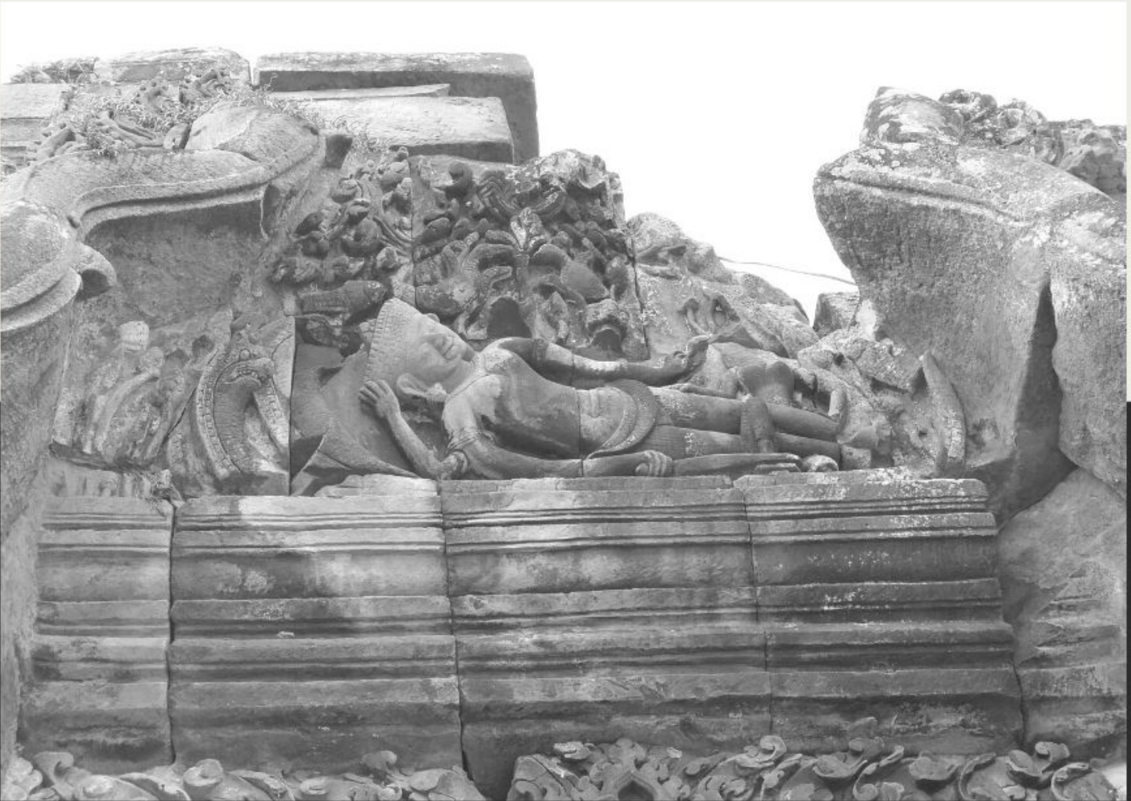
นารายณ์บรรทมสินธุ์ พระธาตุนารายณ์เจงเวง อำเภอเมือง จังหวัดสกลนคร

ด้านนอกเมืองสกลนครเก่าด้านทิศตะวันออกเฉียงใต้ระยะทางประมาณ ๒ กิโลเมตร มีพระธาตุอุดมซึ่งเป็นปราสาทศิลปะเขมรโบราณในคติศาสนาฮินดู อายุราวปลายพุทธศตวรรษที่ 16 – 17 ตั้งอยู่ในเขตวัดพระธาตุอุดม อำเภอเมืองสกลนคร พระธาตุนารายณ์เจงเวงปราสาทในคติศาสนาฮินดูไศวะนิกายศิลปะเขมรสมัยบาปวนตอนปลายราวปลายพุทธศตวรรษที่ 16 – ต้นพุทธศตวรรษที่ 17 มีภาพสลักพระนารายณ์บรรทมสินธุ์และพระศิวะนาฏราชตลอดจนภาพสลักมหากาพย์รามายณะที่มีความสัมพันธ์กับบรรดาศาสนสถานสำคัญที่ราชวงศ์มหิธรประสร้างขึ้น เช่น ปราสาทหินพิมาย จังหวัดนครราชสีมา ปราสาทพหินพนมรุ้ง จังหวัดบุรีรัมย์ เป็นต้น