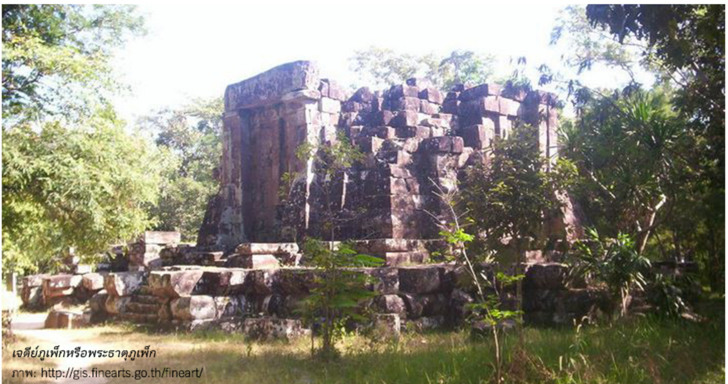
เจดีย์ภูเพ็กหรือพระธาตุภูเพ็ก

ห่างจากตัวเมืองสกลนครเก่าไปทางทิศตะวันตกประมาณ 22 กิโลเมตร ในเขตอำเภอพรรณานิคม มีโบราณสถานสำคัญคือ พระธาตุภูเพ็ก ที่ตั้งอยู่บนยอดภูเพ็ก หนึ่งในยอดเขาสูงในเขตเทือกเขาภูพาน โดยอยู่สูงจากระดับน้ำทะเลปานกลางประมาณ ๕๒๒ เมตร มีลักษณะเป็นปราสาทขนาดใหญ่ประเภทศาสน-บรรพตในคติศาสนาฮินดูไศวะนิกายก่อด้วยหินทรายทั้งหลัง มีศิลปะเป็นประธานของศาสนสถานมีอายุราวปลายพุทธศตวรรษที่ 16 - 17 ที่อาจเทียบได้กับปราสาทพระวิหาร ประเทศกัมพูชา แม้ศาสนสถานแห่งนี้จะสร้างไม่เสร็จสมบูรณ์ เนื่องจากยังไม่มี การแกะสลักลายประดับแต่ก็มีการใช้งาน ประกอบพิธีกรรมแล้ว นอกจากนี้แล้วประติมากรรมรูปพระโพธิสัตว์ในอาคารทรงสามเหลี่ยมอายุราว ปลายพุทธศตวรรษที่ 16 - 17 ถ้าพระ อุทยานประวัติศาสตร์ภูพระบาท จังหวัดอุดรธานี ตามคติพุทธศาสนamahayana ก็แสดงอิทธิพลศิลปกรรมจากปราสาทพระวิหารเป็นอย่างมาก