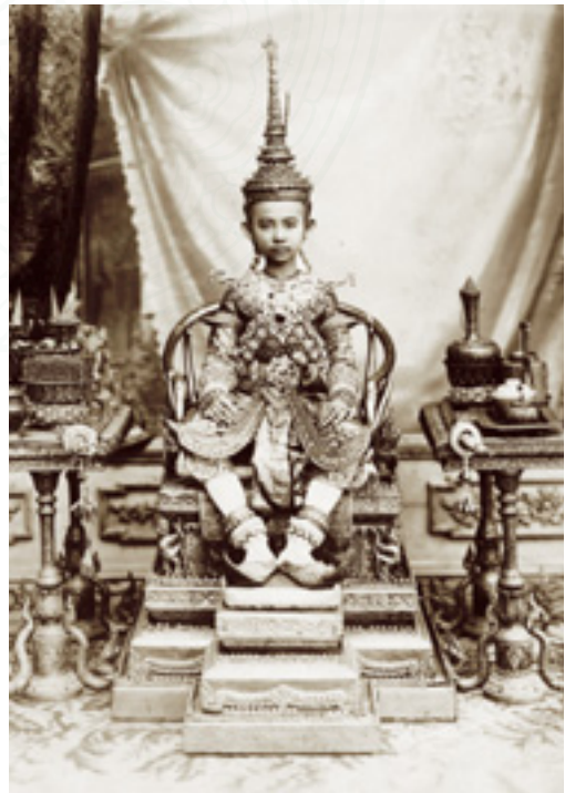
สมเด็จพระเจ้าฟ้ามหิดลอดุลยเดช กรมขุนสงขลานครินทร์ ฉลองพระองค์ชุดเวียนเทียนสมโภช