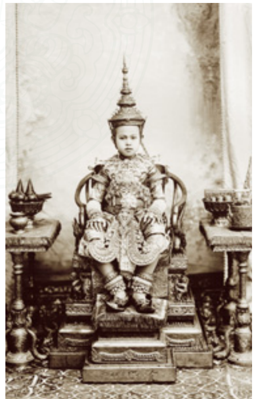
พระองค์เจ้าหญิงทิพยาลังการ ฉลองพระองค์ชุดเวียนเทียนสมโภช

๒๒. หามพระราชยาน ก่อนพิธีสงฆ์ สวมเลื้อยหมวกกลีบลำดับวน ผ้าตัวนขาวขลิบ ทองเทศ นุ่งกางเกงผ้ายก คาดเฉียงบาดขาว ขลิบทองเทศ หลังพิธีสงฆ์ สวมกางเกงเข็ม ขาไหมเขียว