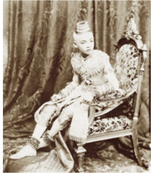
พระองค์เจ้าชายรังสิตประยูรศักดิ์ ฉลองพระองค์ชุดสดับพระสงฆ์เจริญพระพุทธมนต์ ในพระราชพิธีโสกันต์

เมื่อพระเจ้าลูกยาเธอ พระเจ้าลูกเธอ หรือพระเจ้าหลานเธอสร่งน้ำเสร็จแล้ว เสด็จฯ เข้าในพลับพลาเปลื้องเครื่องทรงผลัดพระภูษา เปลี่ยนฉลองพระองค์ถอดเป็นทรงฝ่ายกนิบ หน้านาง ทรงสไบ และผ้าทรงสะพัก สำหรับ เจ้านายผู้หญิง และทรงผ้ายกกนิบหน้านาง สวม ฉลองพระองค์ครุยแขนเดียว โดยพับส่วนที่เหลือ ขึ้นพาดเฉียงบ่า ทรงสไบทับครุย สำหรับเจ้านาย ผู้ชาย ใช้เครื่องประดับชุดเดิม สวมมงคลยน