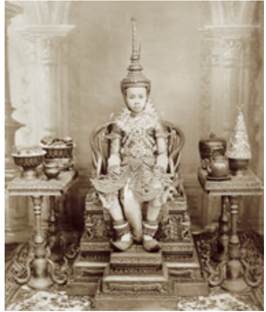
สมเด็จพระเจ้าลูกเธอ เจ้าฟ้ามาลินีนพดารา สิริวิภาวดี ฉลองพระองค์ชุดเวียนเทียนสมโภช

๑๙. ไม้บัณเฑาะว์ พราหมณ์เป่าสังข์ นุ่งผ้าขาว เลื้อยครุยขาวขลิบทองเทศ ต้นแขน ปลายแขนสำรด ตลอดงานพระราชพิธี