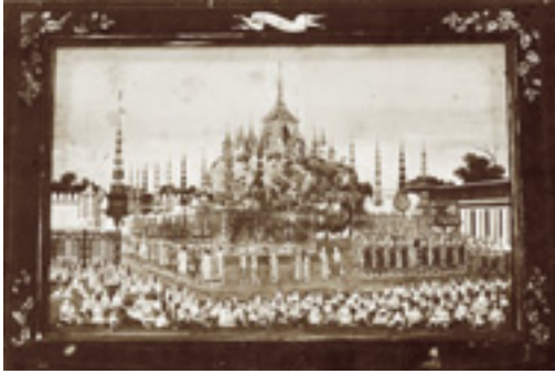
กระบวนแห่พระราชพิธีโสกันต์ เจ้าฟ้ากุณฑลทิพยวดี ณ เขาไกรลาส เขียนโดย พระวรวงศ์เธอวิจิตร (ทอง)

๒๓. อินทร์พรหม สวมเสื้อหางยาว ๓ ชั้น พรหมใช้เสื้อแดง อินทร์ใช้เสื้อสีเขียว สวมสนับเพลา นุ่งสมปักลายมีเครื่องอาภรณ์ซีก สวมสร้อยลูกปัด สวมเทริดลายรดน้ำ ตลอดงานพระราชพิธี