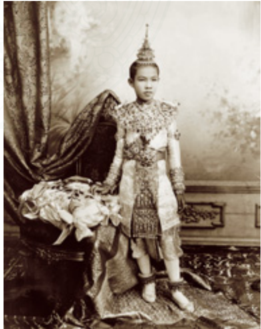
พระองค์เจ้าหญิงอาทรทิพยนิภา ฉลองพระองค์ชุดลำดับพระสงฆ์เจริญพระพุทธมนต์ ในพระราชพิธีโสกันต์