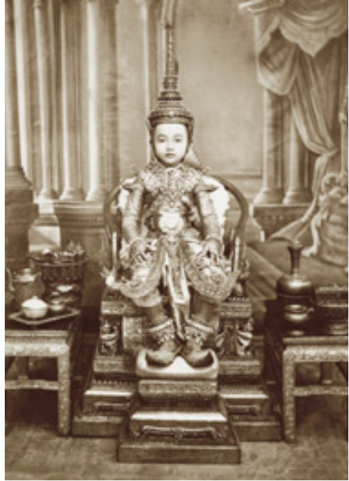
สมเด็จพระเจ้าฟ้า กรมขุนเทพทวาราวดี ฉลองพระองค์ชุดเวียนเทียนสมโภช