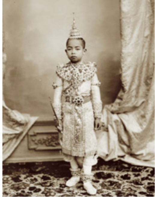
สมเด็จพระเจ้าฟ้า กรมขุนนครราชสีมา ฉลองพระองค์ชุดลำดับพระสงฆ์เจริญพระพุทธมนต์ ในพระราชพิธีโสกันต์