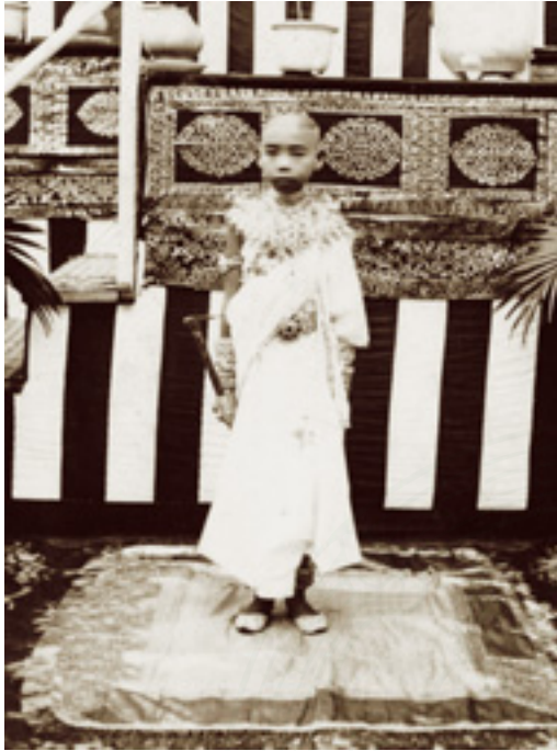
สมเด็จพระเจ้าฟ้าชายจุฑาธุชธราดิลก ฉลองพระองค์ในวันโสกันต์