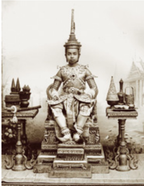
สมเด็จพระเจ้าฟ้า กรมขุนนครราชสีมา ฉลองพระองค์ชุดเวียตนามสมโภช

๑๒. คู่แท้เด็กญวน ก่อนพิธีสร่งน้ำ สวมเสื้อแพรขาวขลิบทองเทศ กางเกงแพรต่างสี โปกผ้าสีดำ หลังพิธีสร่งน้ำ สวมเสื้อสี