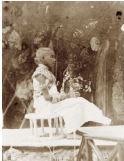
สมเด็จพระเจ้าฟ้าชายจุฑาธุชธราดิลก ระหว่างพิธีสรนน้ำ