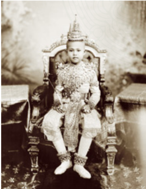
พระองค์เจ้าหญิงทิพยาลังการ ฉลองพระองค์ชุดลำดับพระสงฆ์เจริญพระพุทธมนต์ ในพระราชพิธีโสกันต์