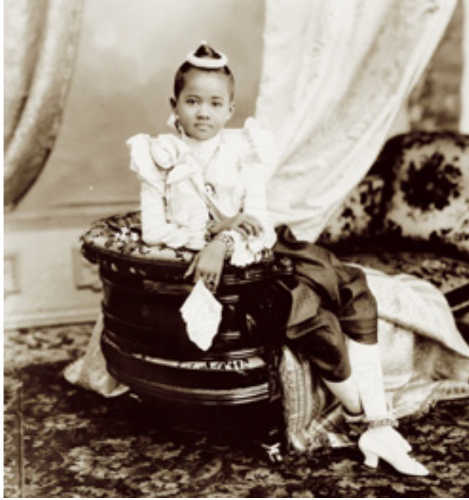
สมเด็จพระเจ้าลูกเธอ เจ้าฟ้าฉันทาภดล วิมลประภาวดี ก่อนทรงโสกันต์

ในสมัยโบราณเด็กๆ ไม่ว่าจะเป็นลูกหลานสามัญชนทั่วไป บุตรธิดาของขุนนางผู้ใหญ่ พระราชโอรสพระราชธิดาของพระมหากษัตริย์ส่วนมากมักจะไว้ผมจุก* โดยจะไว้จุกจนอายุได้ ๑๑ - ๑๓ ปี บิดามารดาก็จะทำพิธีโกนจุกซึ่งจัดเป็นงานมงคลใหญ่ให้ เด็กผู้หญิงจะเติบโตเร็วกว่าเด็กผู้ชายจึงมักจะโกนจุกตั้งแต่อายุ ๑๑ ปี ส่วนเด็กผู้ชายจะโกนจุกเมื่ออายุระหว่าง ๑๑ - ๑๓ ปี