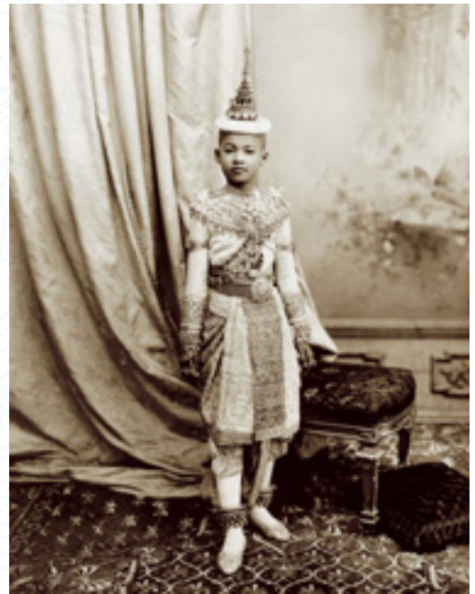
พระองค์เจ้าหญิงอติศัยสุริยาภา ฉลองพระองค์ชุดสดับพระสงฆ์เจริญพระพุทธมนต์ ในพระราชพิธีโสกันต์

๖. กลองแขก ปี่ชวา นำริ้ว ก้อนพิธีสงฆ์ น้ำ แต่งตัวอย่างมลายู ทุ่งโสรงไหม เสื้ออัลดัดขาว คาดปั้นเหน่ง โปกผ้าหนึ่งเขียนทอง หลังพิธีสงฆ์ สวมเสื้ออัลดัดแดง