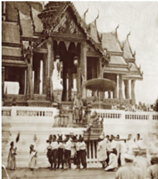
สมเด็จพระเจ้าฟ้า กรมหมื่นพิฆเนศวรสุรสังกาศ ทรงเข้ากระบวนไปประกอบพิธีเวียนเทียนสมโภช

๗. กลองชนะ สวมเสื้อกางเกงปักตุ ๒๔ แดง ตลอดงานพระราชพิธี