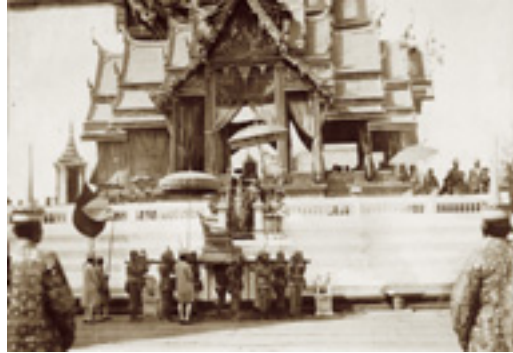
สมเด็จพระเจ้าฟ้าหญิงสุทธาทิพยรัตน์ สุขุมขัตติยกัลยาวัดี ทรงรอเข้ากระบวนไปประกอบพิธีเวียตนามสมโภช

๑๕. คู่แท้เด็กลาวทรงดำ ก่อนพิธีสร่งน้ำ นุ่งกางเกงยาวสีน้ำเงินมีแถบทอง สวมเสื้อไหมดเทศพื้นขาวขลิบทองยาว คาดรัดคตผ้าตะบิต โปกผ้าโปร่งลายทองสลับลี หลังพิธีสร่งน้ำ สวมเสื้อไหมดเทศสีแดง