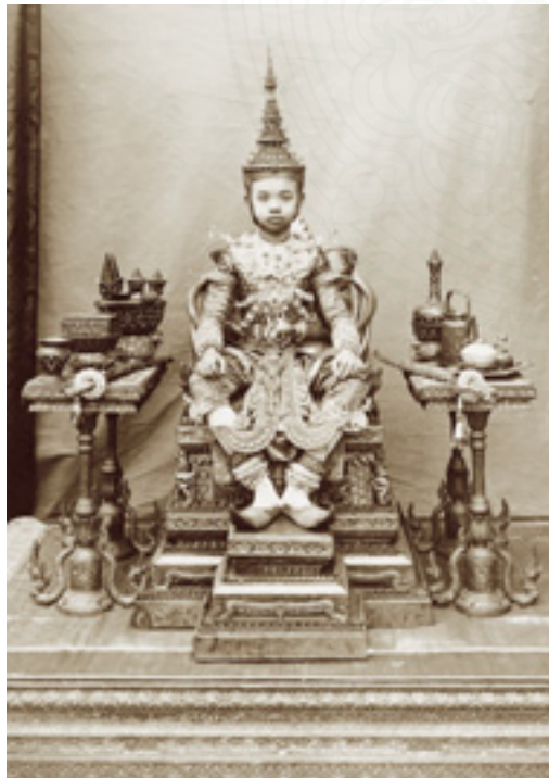
สมเด็จพระเจ้าฟ้าประชาธิปกศักดิเดชน์ กรมขุนสุโขทัยธรรมราชา ฉลองพระองค์ชุดเวียนเทียนสมโภช