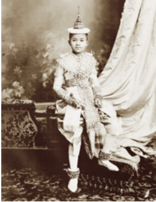
สมเด็จพระเจ้าลูกเธอ เจ้าฟ้านิภาภมล วิมลประภาวดี ฉลองพระองค์ชุดลำดับพระสงฆ์เจริญพระพุทธมนต์ ในพระราชพิธีโสกันต์