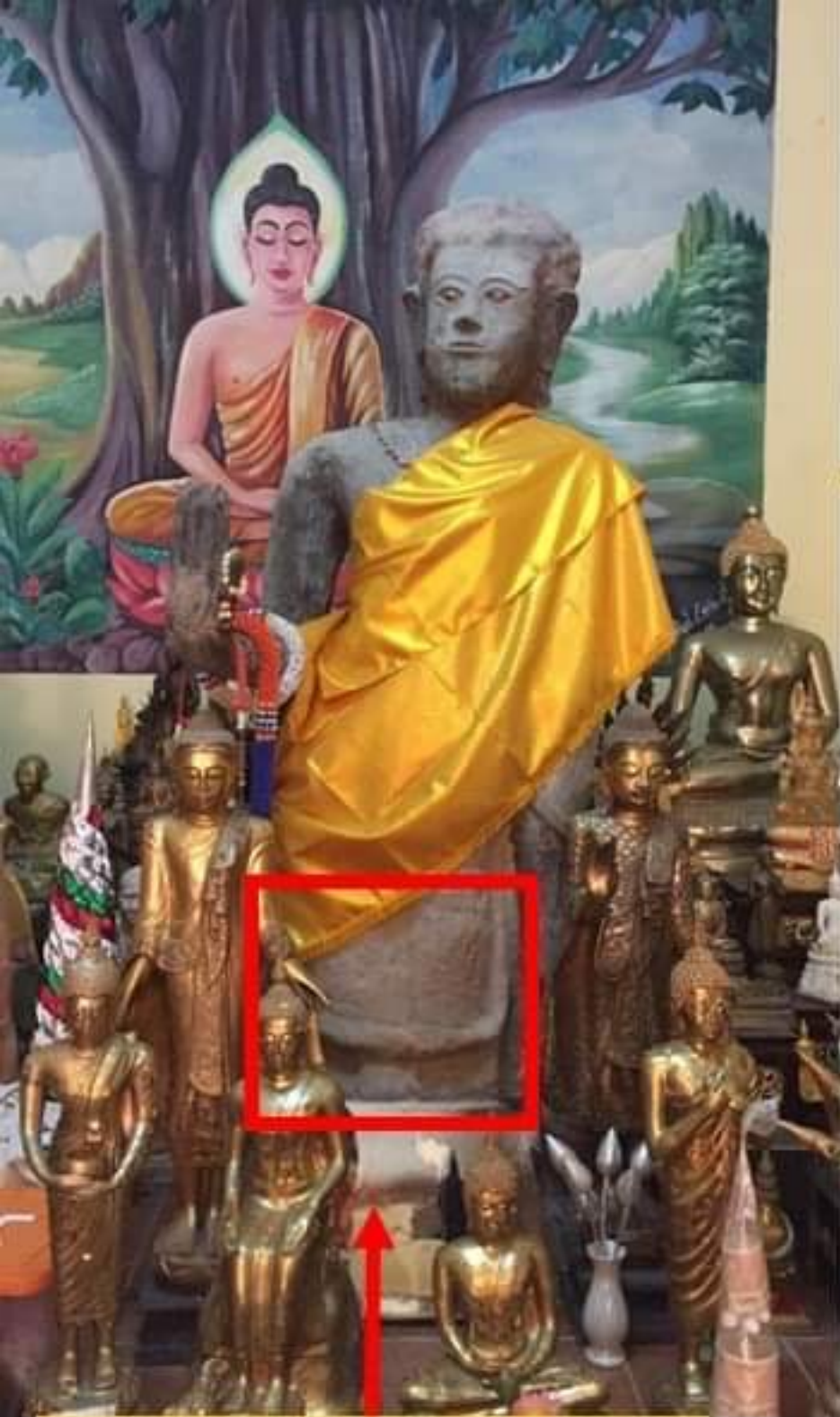
ชายจีวรเป็นวงโค้งรูปตัวยู (U)

สภาพปัจจุบัน พระพุทธรูปองค์นี้ได้ถูกซ่อมแซมและดัดแปลงจนเกิดพุทธลักษณะ ดังนี้