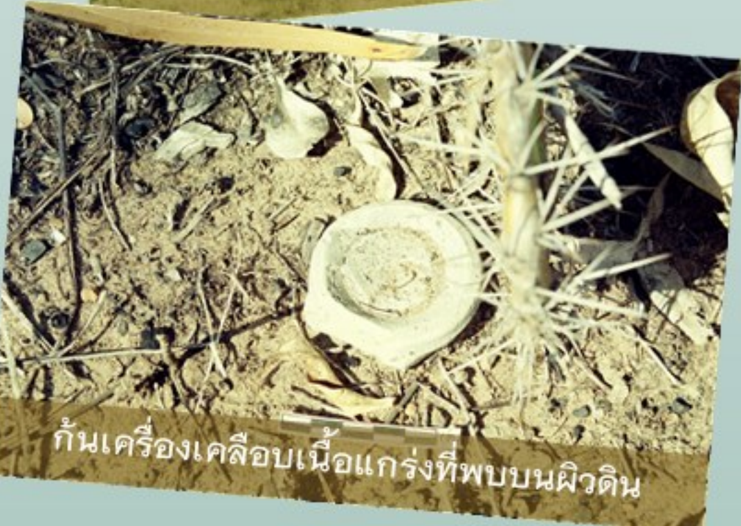
ก้นเครื่องเคลือบเนื้อแกร่งที่พบบนผิวดิน