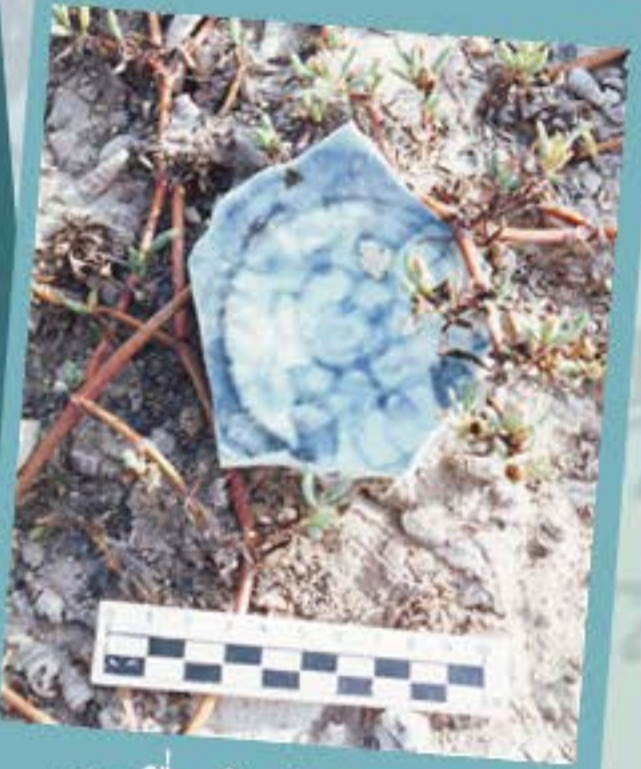
เศษเครื่องถ้วยจีน พบบริเวณ แหล่งโบราณคดีในคู้ง