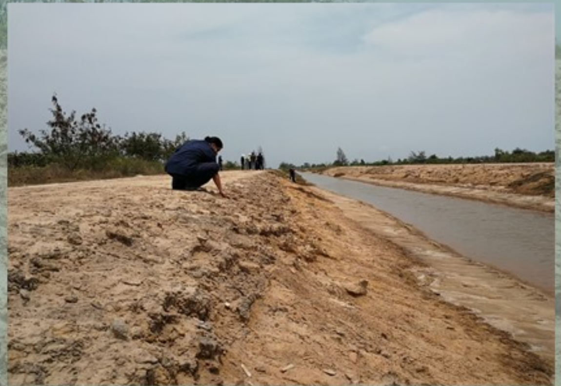
สภาพของแหล่งเป็นเนิน พบเศษภาชนะดินเผาจำนวนมากยาวตลอดแนวคันคลอง

หลังจากลงพื้นที่ตรวจสอบพบเป็นเนินดินขนาดใหญ่ มีร่องน้ำขนาดเล็กผ่ากลาง ปัจจุบันมีการขุดลอกคลองขยายร่องน้ำ ทำให้พบเศษภาชนะดินเผาจำนวนมากในชั้นดินกลางเนิน ส่วนใหญ่ที่พบเป็นเศษภาชนะดินเผาเนื้อดิน (Earthenware) เนื้อดินค่อนข้างละเอียด มีรูวดขนาดเล็กเป็นส่วนผสม ผิวภาชนะตกแต่งด้วยลายเชือกทาบ และทาน้ำดิน พบในปริมาณหนาแน่น อีกทั้งพบเศษภาชนะดินเผาเนื้อแกร่ง (Stoneware) และชิ้นส่วนเครื่องถ้วยจีนเนื้อกระเบื้อง (Porcelain) ร่วมด้วย แต่พบไม่มากนัก