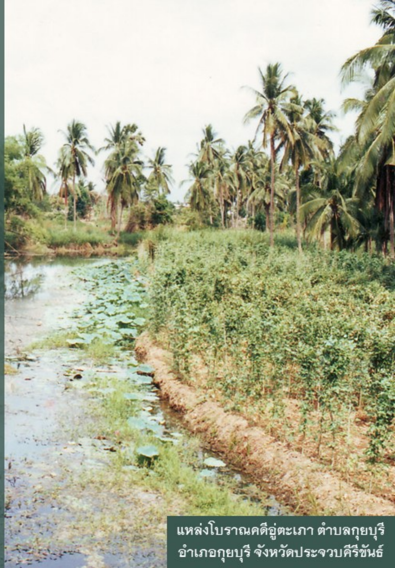
แหล่งโบราณคดีอยู่ตะเภา ตำบลกุยบุรี อำเภอกุยบุรี จังหวัดประจวบคีรีขันธ์

“...รุ่งขึ้นวันที่ 23 เดือนธันวาคม ข้าพเจ้าได้ยกจากเมือง ปราณเพื่อไปยังเมืองกุย ซึ่งเป็นหนทางไกล 9 ไมล์ เมืองกุยนี้เป็นเมืองคล้ายกับเมืองปราณ ตั้งอยู่บนเนินและ มีแม่น้ำเล็ก ๆ ไหลอยู่เชิงเนิน แม่น้ำนี้ไหลไปตกทะเลทาง ประมาณ 1 ไมล์ครึ่ง เรือเดินขึ้นลงได้อย่างสะดวกไปได้ จนถึงท่าทะเลประมาณ 3 ไมล์ ...”