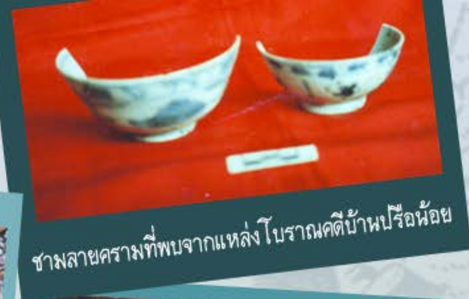
ชามลายครามที่พบจากแหล่งโบราณคดีบ้านปรีอ้อย