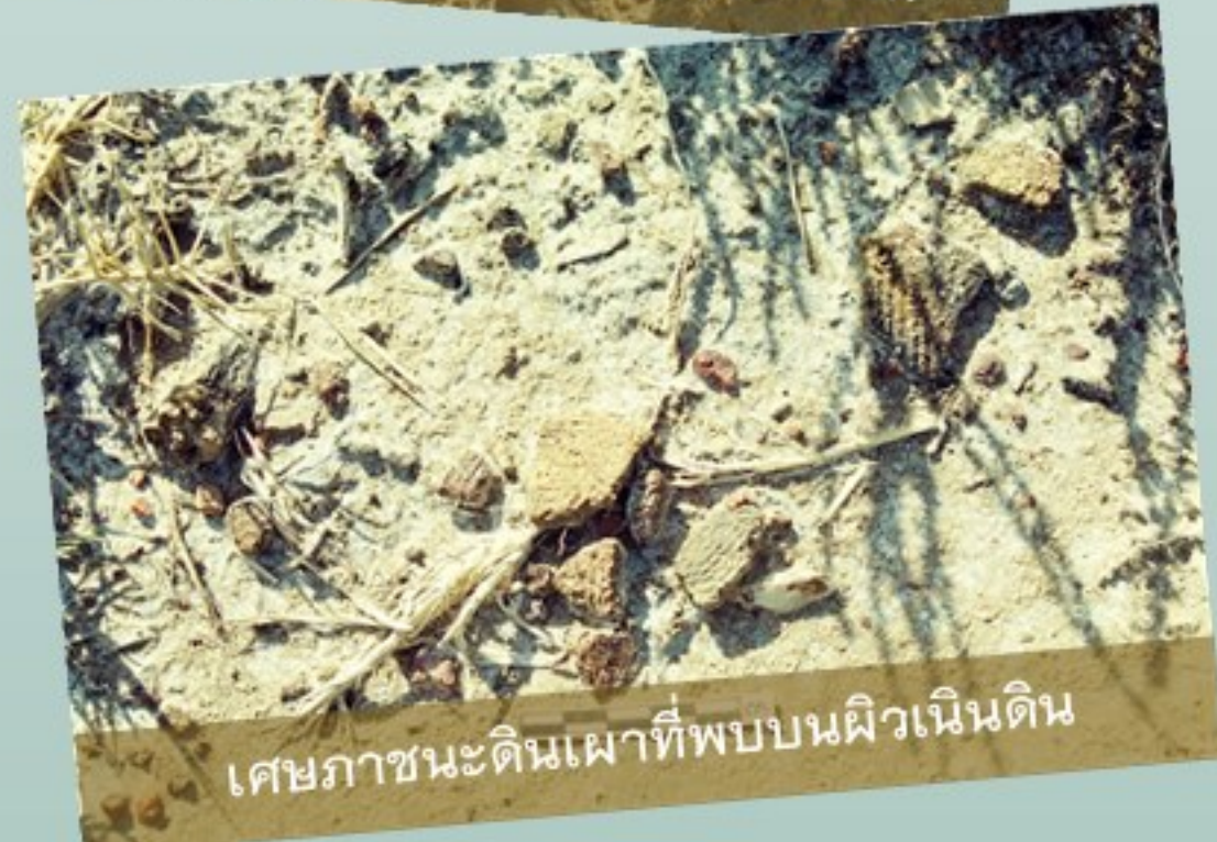
เศษภาชนะดินเผาที่พบบนผิวดิน