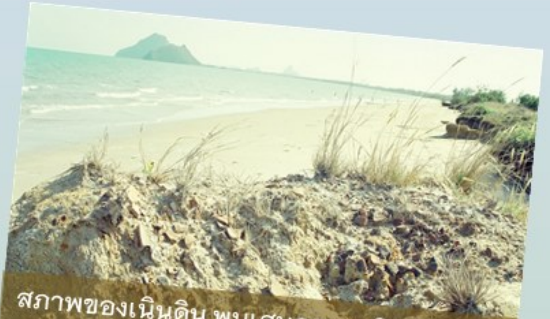
สภาพของเนินดิน พบเศษภาชนะดินเผา และเปลือกหอยกระจายอยู่เป็นปริมาณมาก