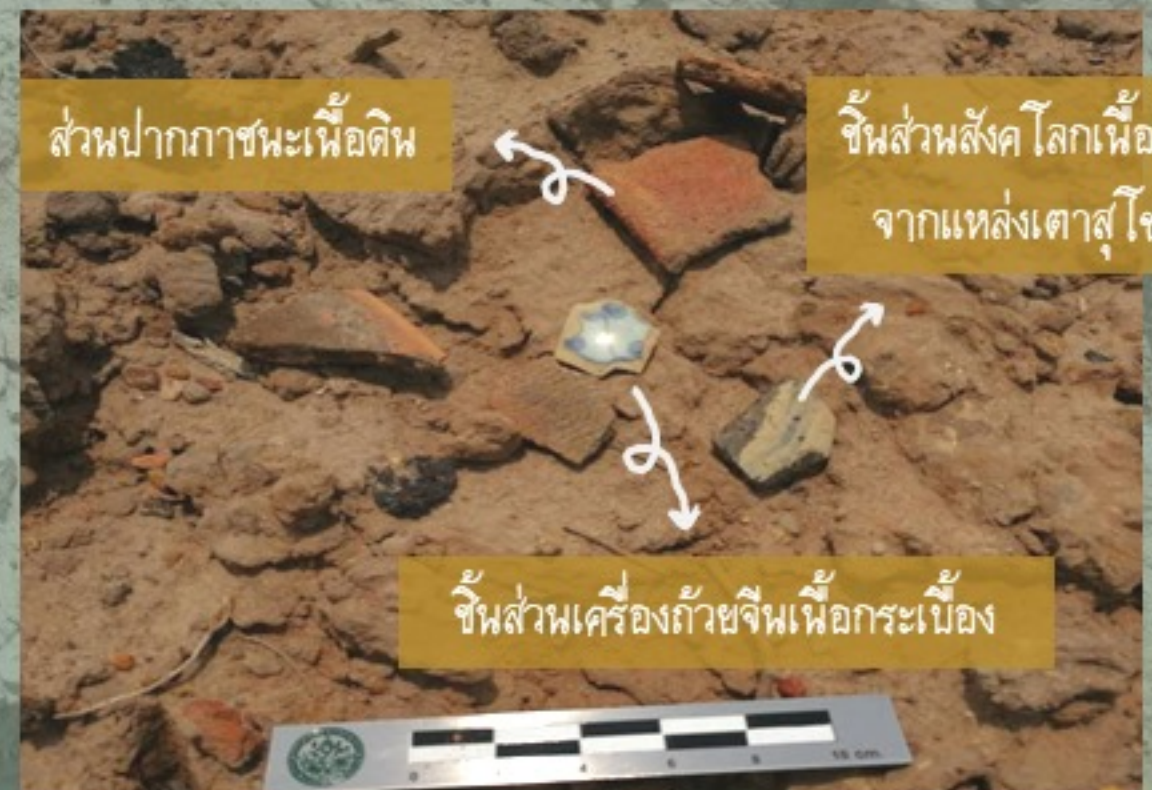
ตัวอย่างเศษภาชนะดินเผาที่พบ