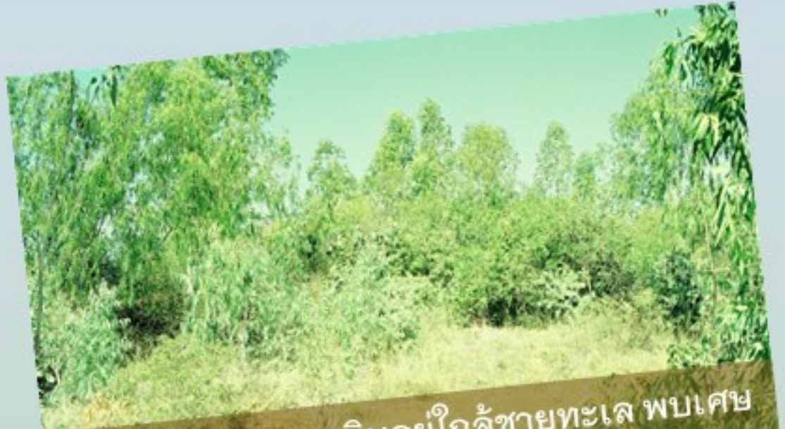
เป็นเนินดินหลายเนินอยู่ใกล้ชายทะเล พบเศษภาชนะดินเผากระจายอยู่บนผิวดิน