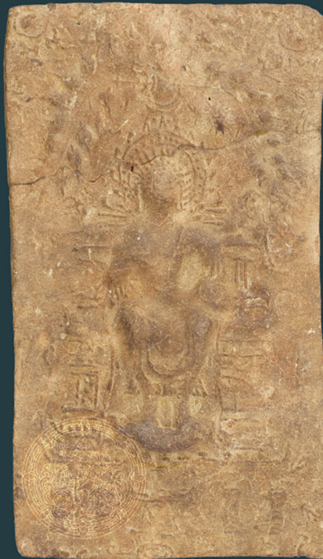
ปางแสดงธรรมนั่งห้อยพระบาทบนบัลลังก์ใต้ต้นโพธิ์