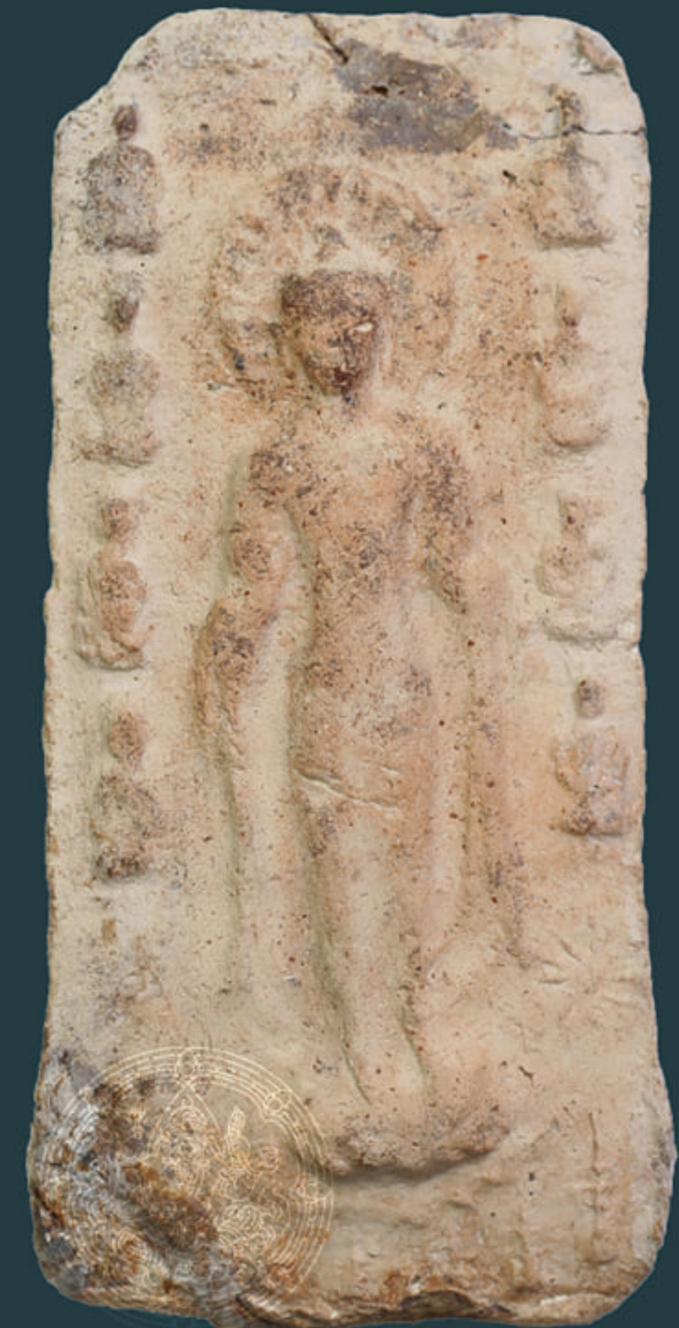
ปางเสด็จจากดาวดึงส์

ปัจจุบันเก็บรักษาและจัดแสดงที่อาคารจัดแสดง พิพิธภัณฑสถานแห่งชาติ ขอนแก่น จังหวัดขอนแก่น