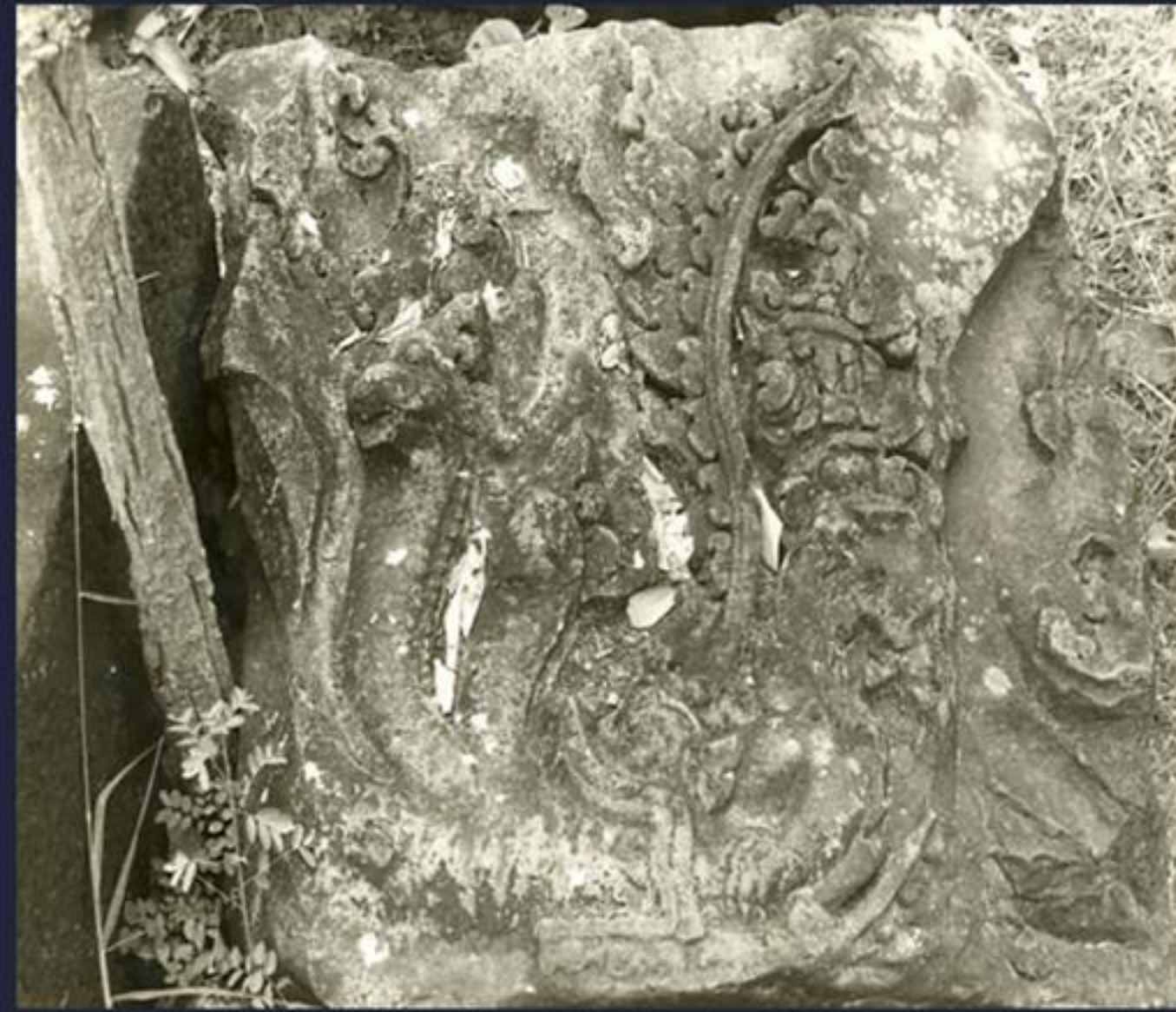
ชิ้นส่วนทับหลัง