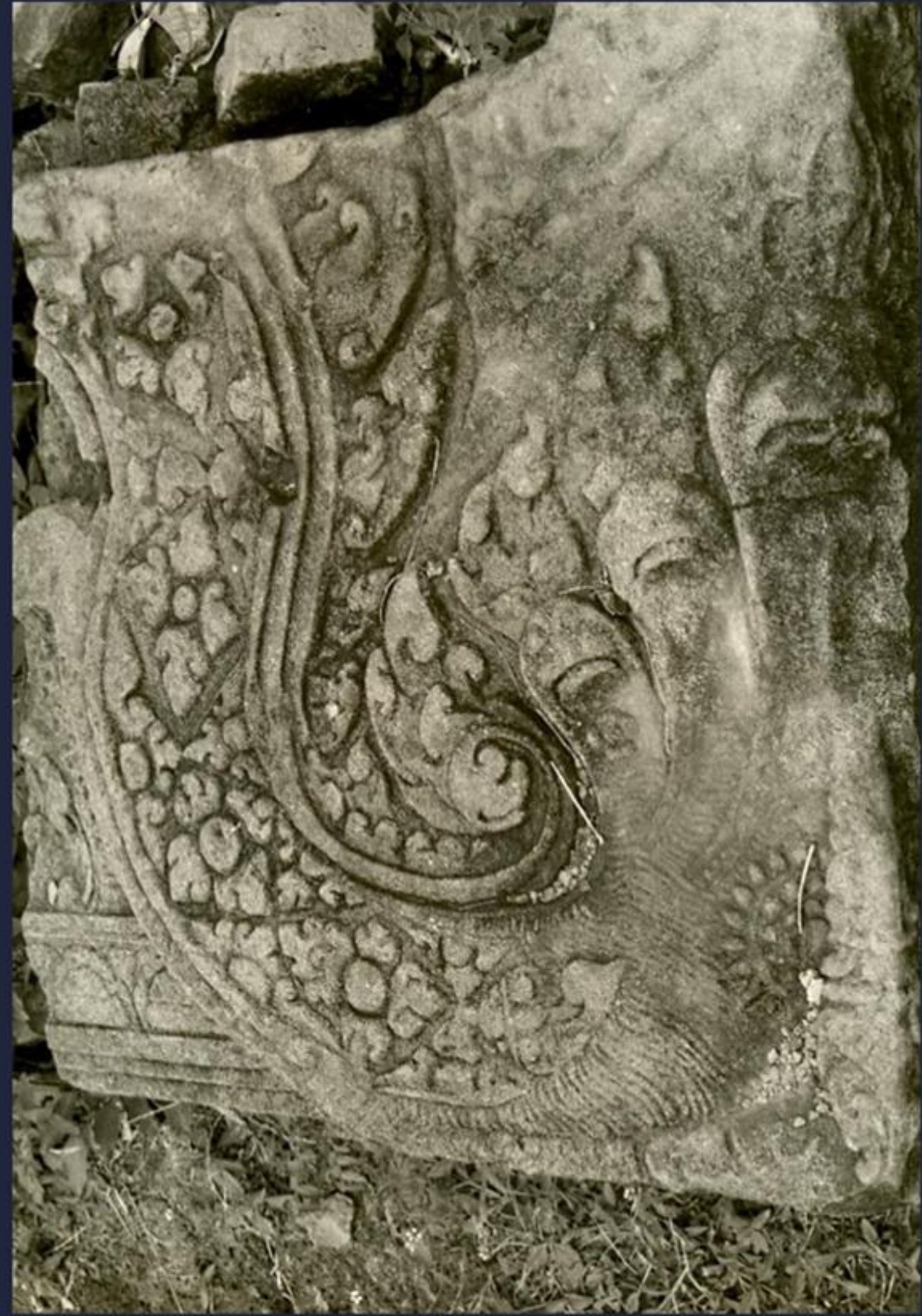
ปลายกรอบหน้าบัน