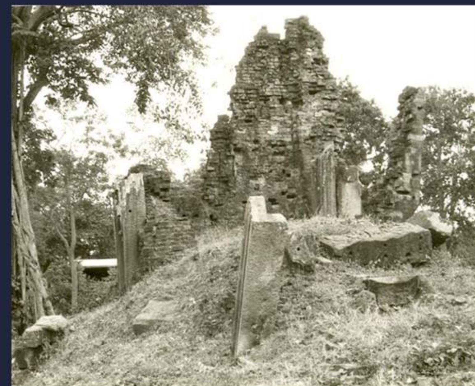
ด้านหลังของปราสาทประธาน