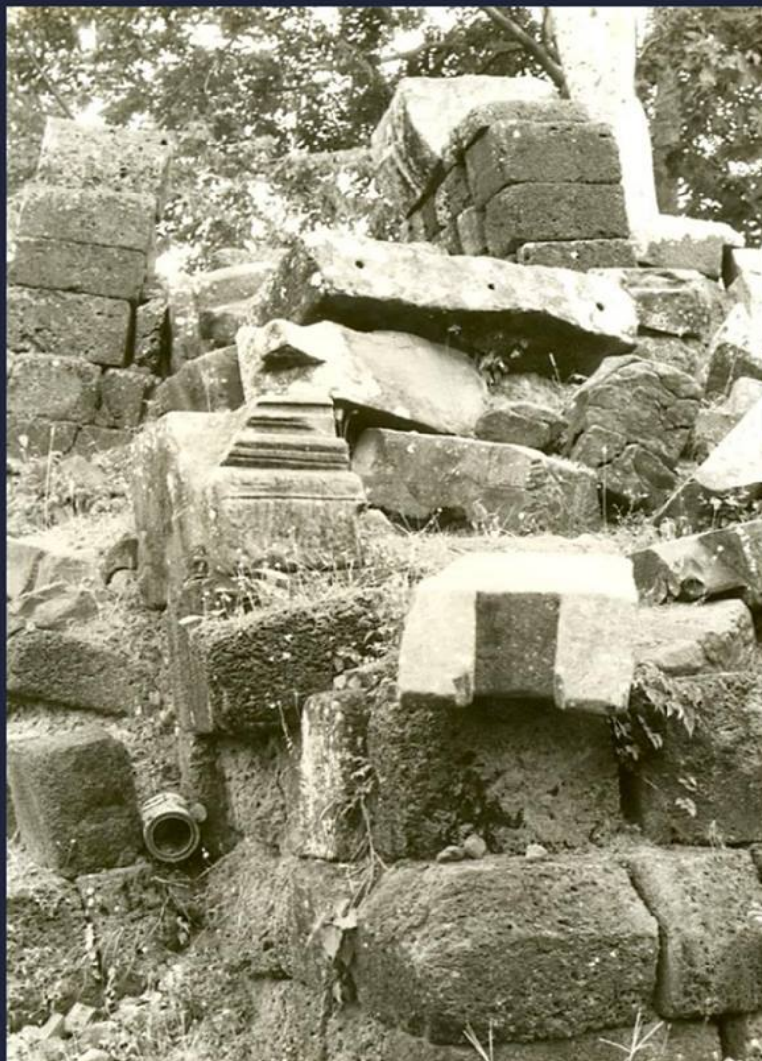
โคปุระด้านตะวันตก