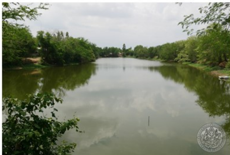
สระขวาง คูเมืองเมืองเพ็ญ