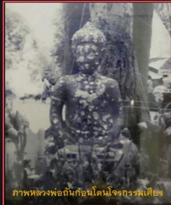
ภาพหลวงพ่อกันก่อนโดนโจรกรรมเคียร