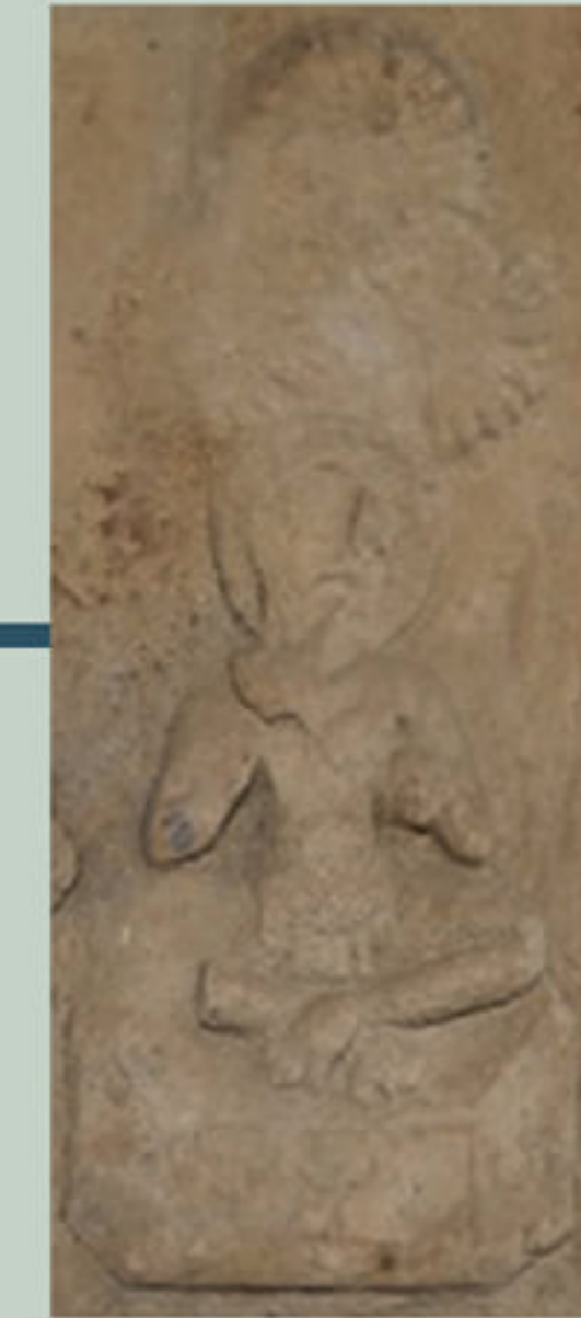
บุคคลที่ ๑ เป็นภาพพระพุทธเจ้า ด้านหลัง พระเศียรมีประภามณฑล นั่งบนบัลลังก์ได้ ต้นไม้ พระหัตถ์ทำปางแสดงธรรม