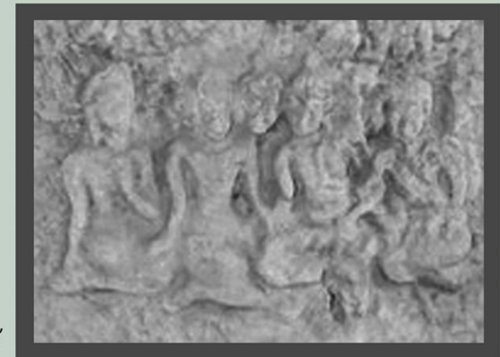
ภาพฉากด้านหลังเป็นต้นไม้ แสดงว่าเหตุการณ์นี้ เกิดขึ้นในป่าและคงเป็น “ป่าอิสิปตนมฤคทายวัน”

ภาพบุคคลจำนวน ๕ คน คงหมายถึง “ปัญจวัคคีย์”