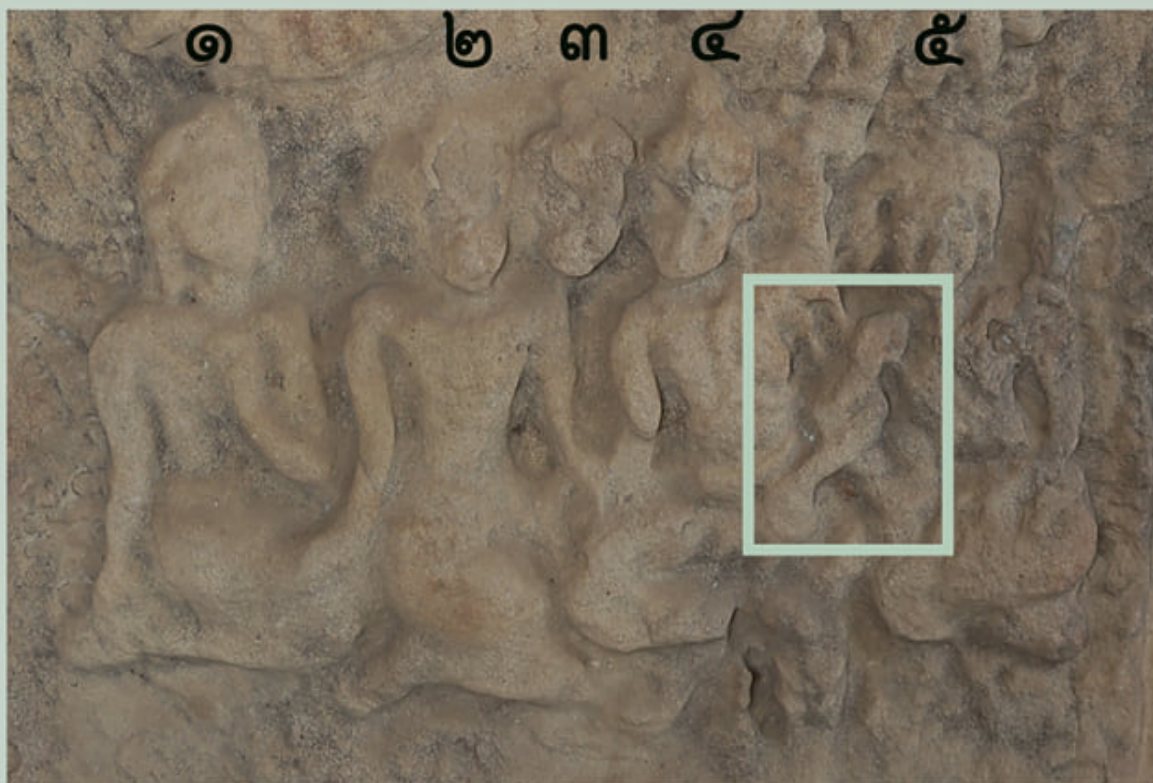
บุคคลจำนวน ๕ คน ลักษณะ มุ่นมวยผม ไว้กลางศีรษะ บุคคลที่ ๔ และ ๕ เออแขน คล้องกัน ทั้ง ๕ คน นุ่งผ้ากรอมเท้า นั่งและ คล้ายกำลังเจรจากัน ฉากหลังเป็นต้นไม้

ภาพบุคคลจำนวน ๕ คน คงหมายถึง “ปัญจวัคคีย์”