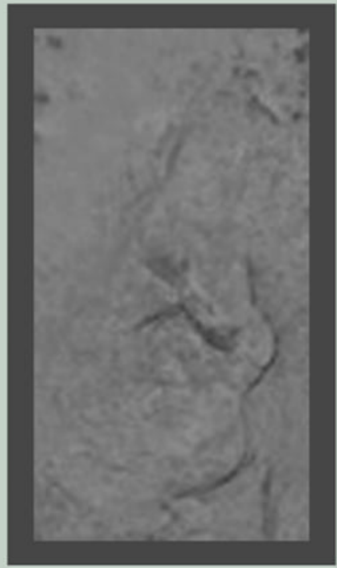
บุคคลที่ ๒ ลักษณะ นั่งชันเข่าและพนมมือ บุคคลนี้ อาจหมายถึงเทพหรือเทวดาที่มา เข้าเฝ้าพระพุทธเจ้า