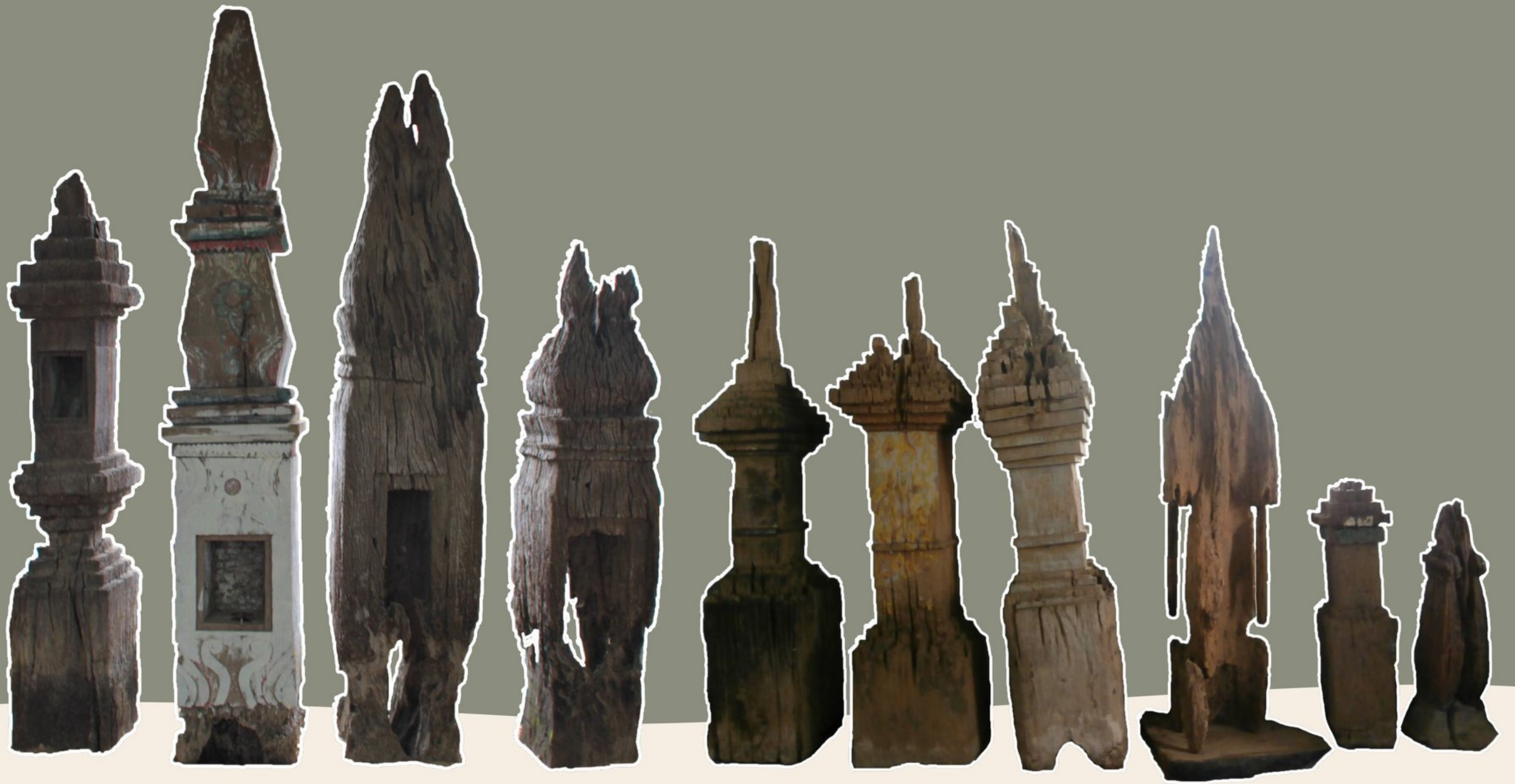
ตัวอย่างธาตุไม้แบบต่างๆ