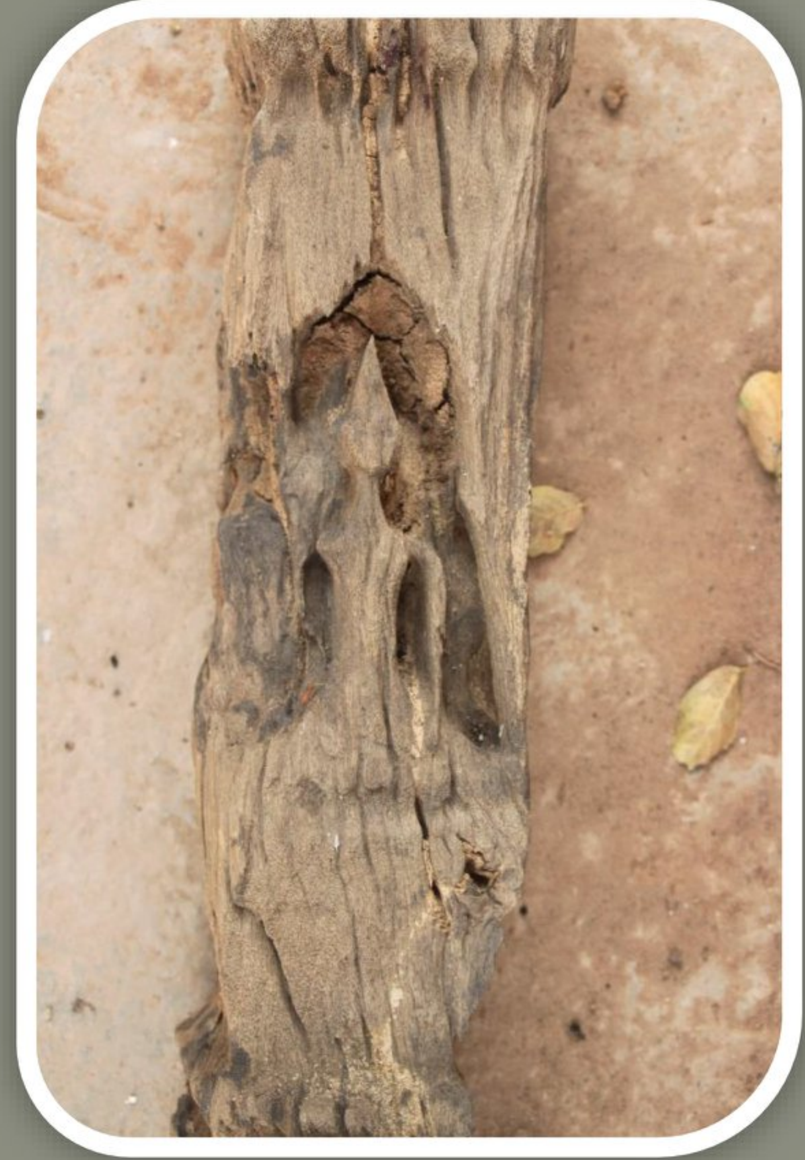
ธาตุไม้จากวัดหันสว่าง อำเภอชุมแพ จังหวัดขอนแก่น บนเรือนธาตุมีการแกะสลักพระพุทธรูป