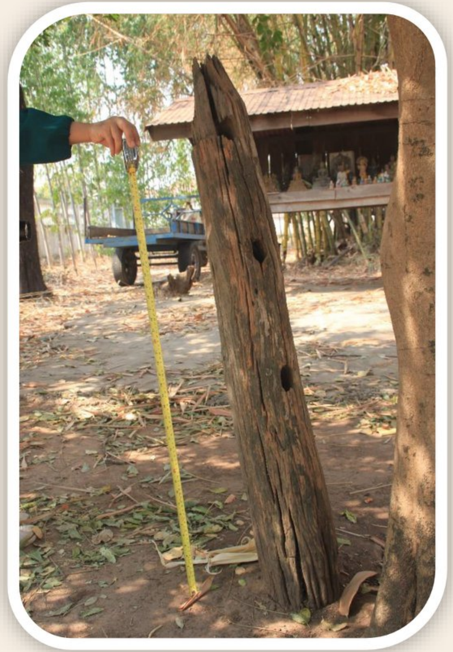
หลักเส หรือเสารั้ววัดเก่า จากวัดหันสว่าง จังหวัดขอนแก่น