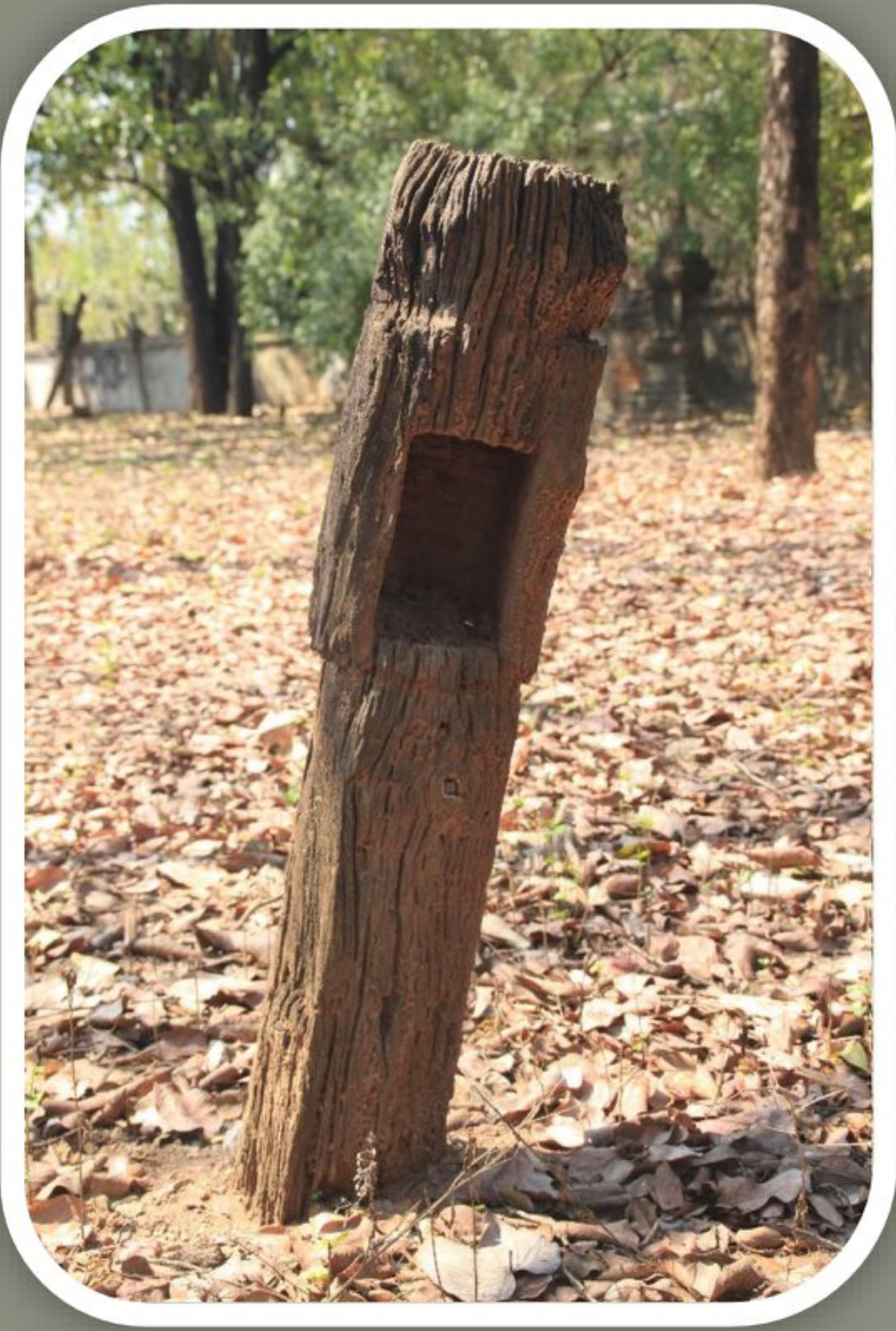
ธาดูไม้จากวัดบึงนาเพียง จังหวัดขอนแก่น ที่มีรูปทรงคล้ายหลักเส