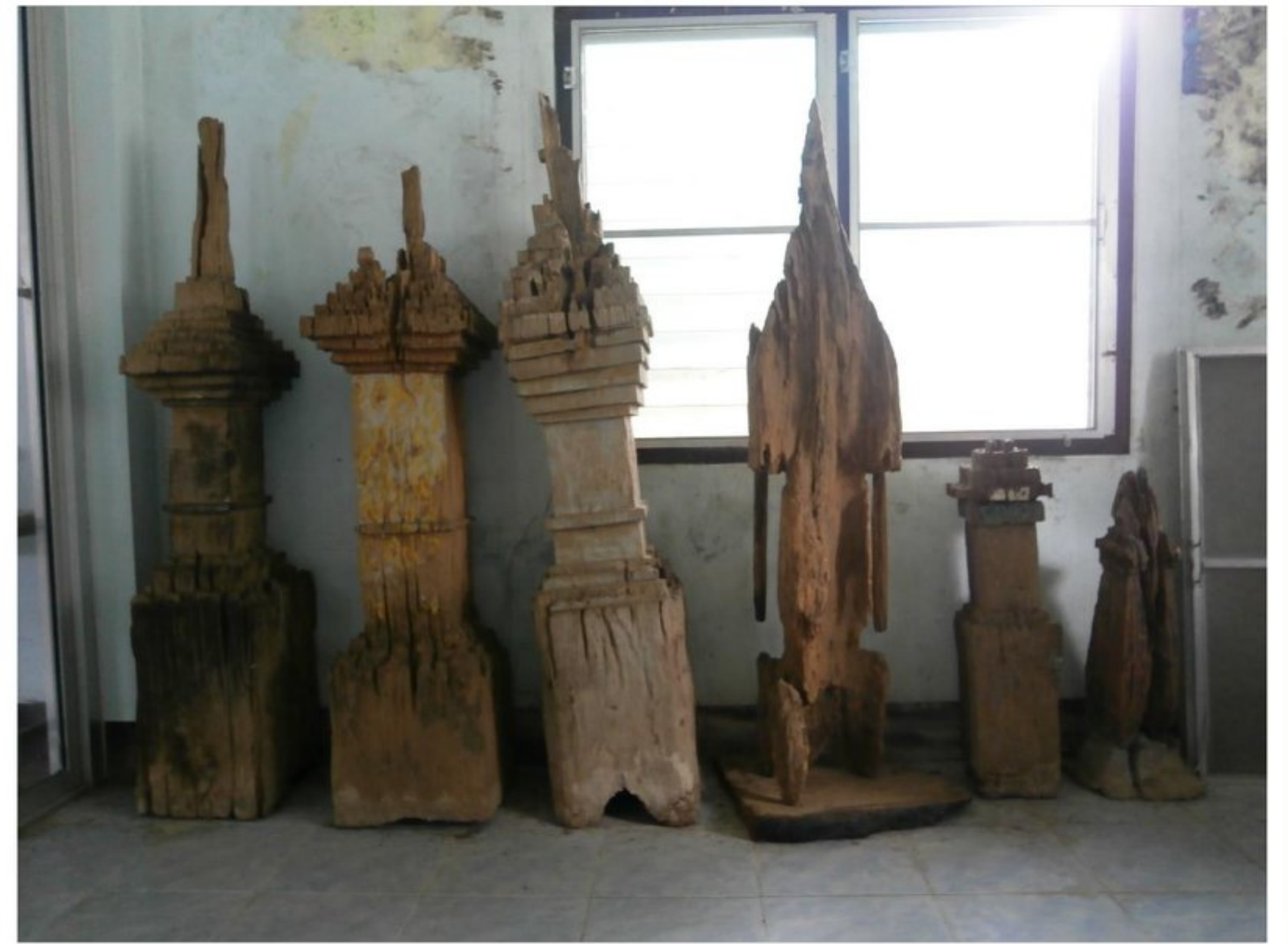
ธาทูไม้จากวัดโพนทอง อำเภอภูเรือ จังหวัดเลย ปัจจุบันทางวัดได้นำมาเก็บรักษาไว้ภายในอาคารพิพิธภัณฑ์