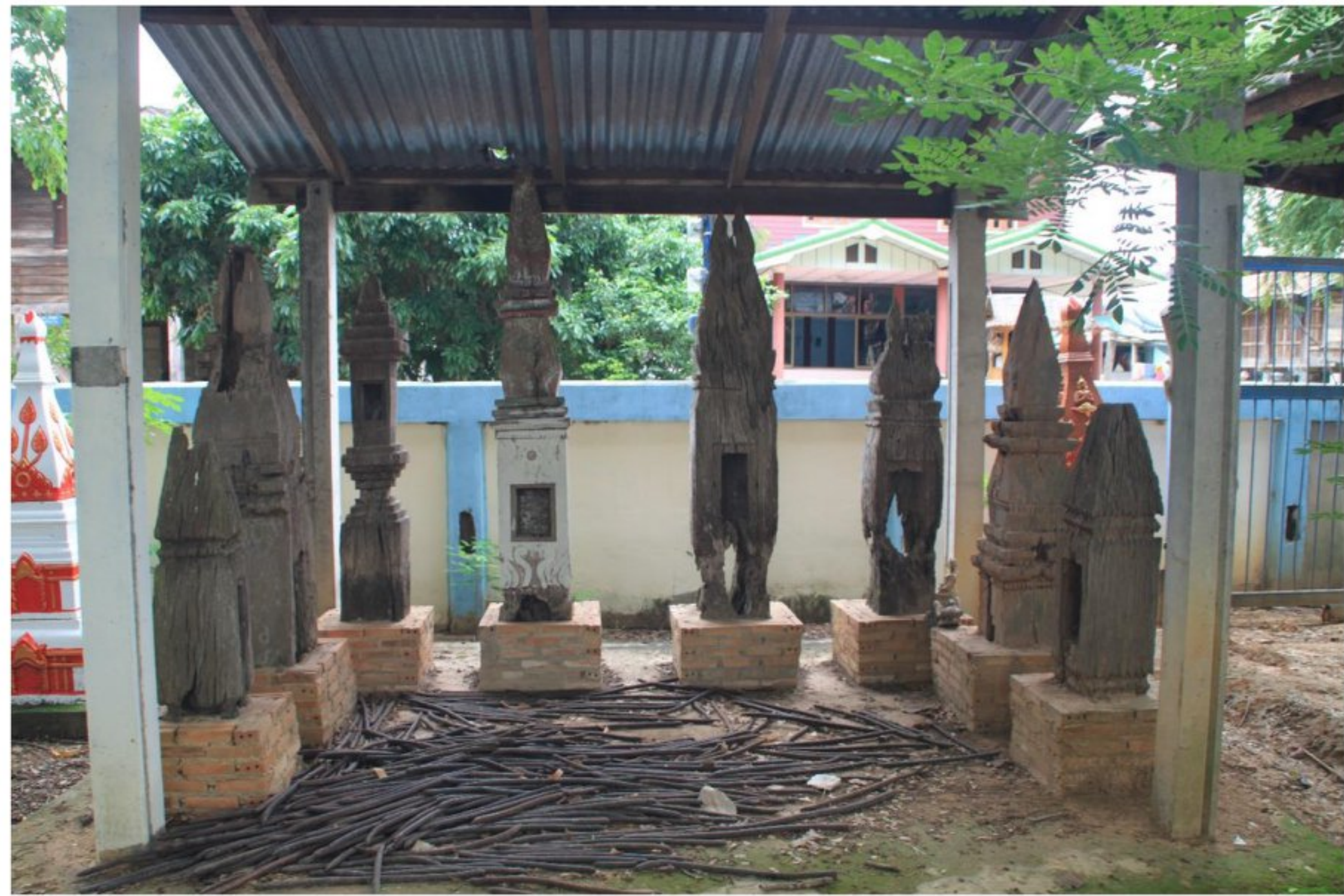
ธาทูไม้จากวัดประสาธน์รัทธา อำเภอนากลาง จังหวัดหนองบัวลำภู ทางวัดได้รวบรวมมาปักไว้ในศาลา เพื่อป้องกันการผุพังจากน้ำฝน