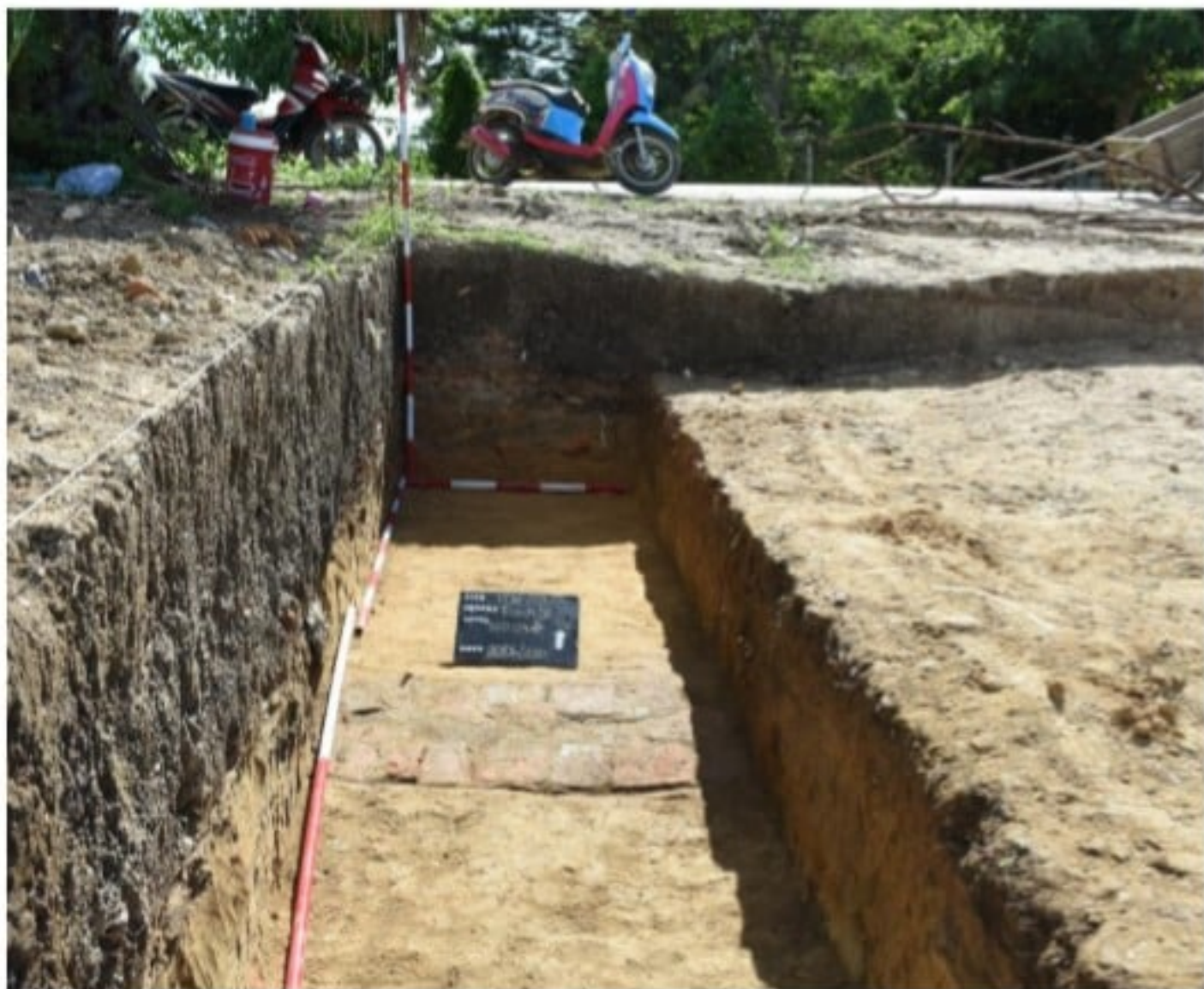
แนวอิฐขนาดความกว้าง ๕๐ เซนติเมตรที่พบจากการขุดหลุมยาวเพื่อตรวจสอบหาแนว