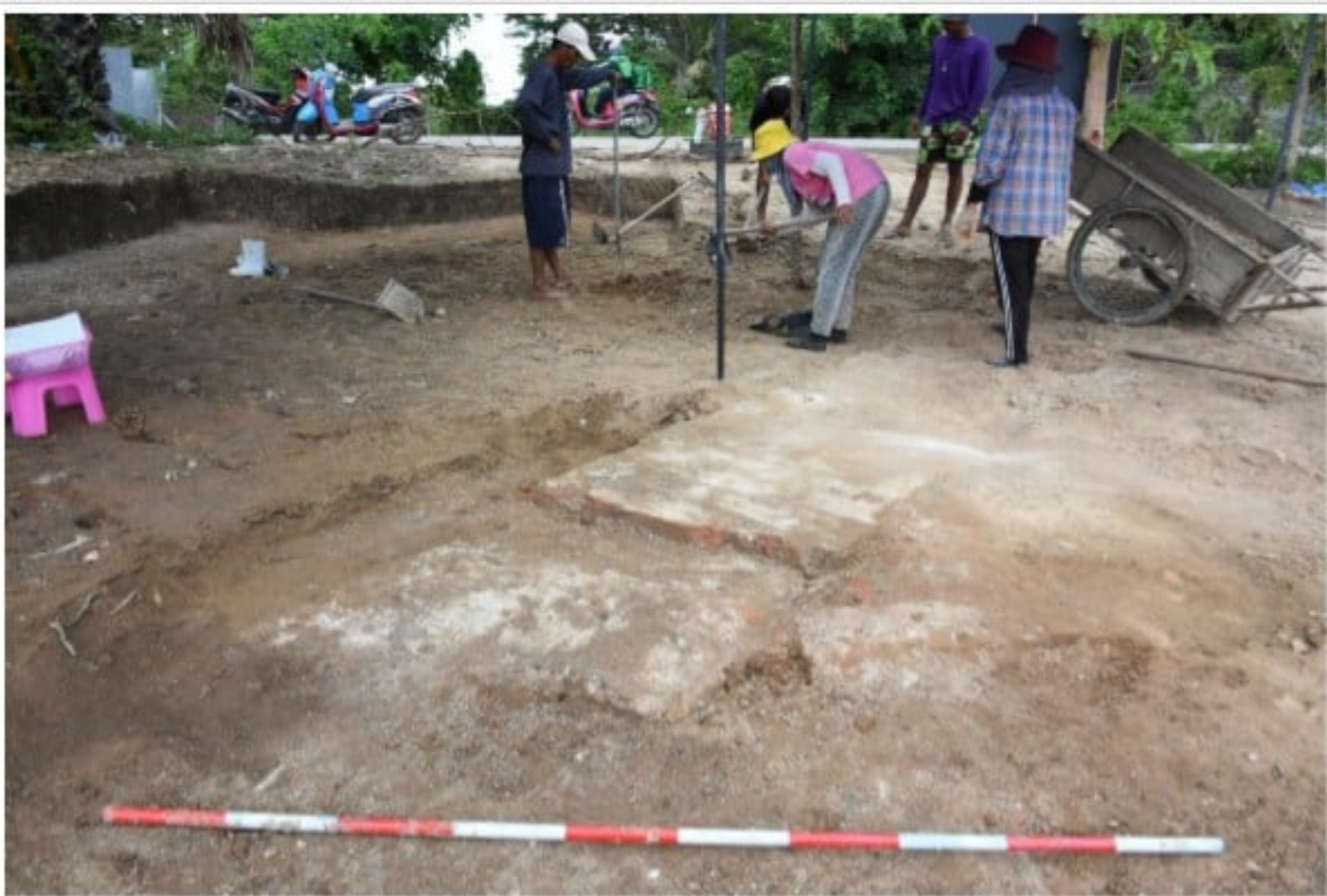
ร่องรอยซากฐานสิ่งก่อสร้างที่อยู่บนผิวดินมีขนาดความกว้างประมาณ ๑ เมตร