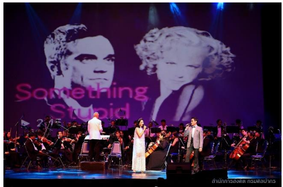
ภาพการแสดงรายการศิลปะการคอนเสิร์ต