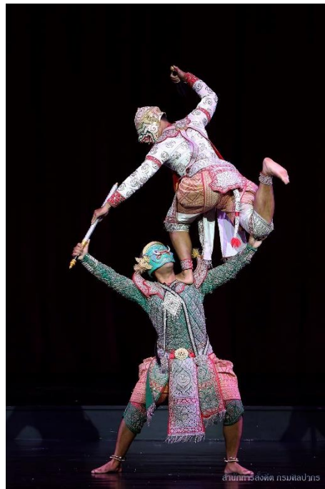
ภาพการแสดงโขน เรื่องรามเกียรติ์ ชุดการกลมนต์มาร