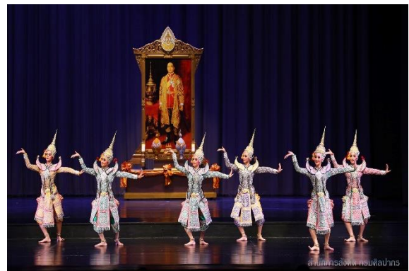
ภาพการแสดงรายการคีรีสุขนาฏกรรม