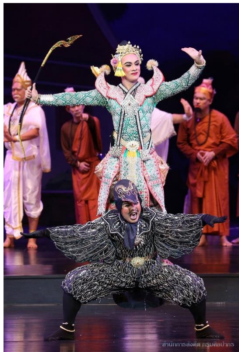
ภาพการแสดงโขน เรื่องรามเกียรติ์ ชุด ปราบากนาสูร