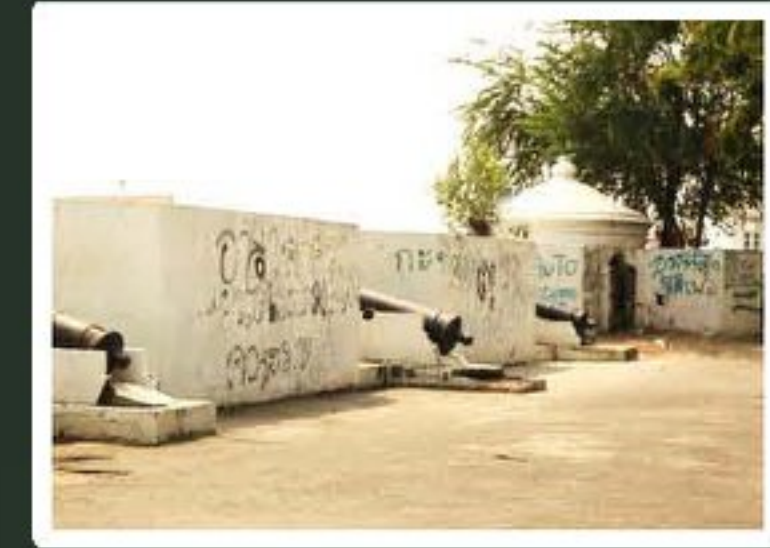
ภาพป้อมวิเชียรโชฎิก ตำบลมหาชัย อำเภอเมืองสมุทรปราการ

สมัยพระบาทสมเด็จพระนั่งเกล้าเจ้าอยู่หัว (รัชกาลที่ 3) ราว พ.ศ.2369 โปรดเกล้าฯ ให้พระยาโชฎิกกราชเศรษฐี (ทองจีน) ก่อสร้างป้อมปราการขึ้นบริเวณจุดบรรจบระหว่างปากคลองมหาชัยกับแม่น้ำท่าจีน พระราชทานชื่อ “ป้อมวิเชียรโชฎิก”