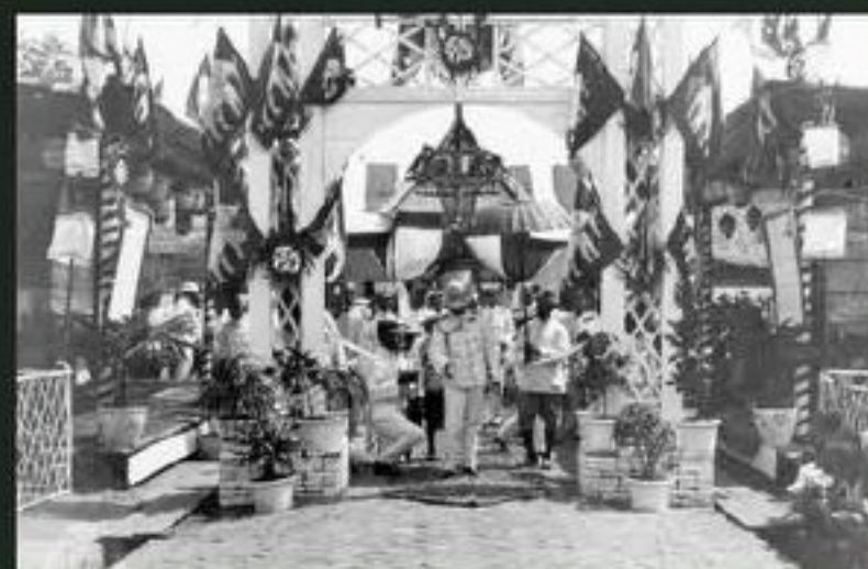
ภาพการเสด็จพระราชดำเนินตำบลบ้านตลาดท่าฉลอม

สมัยพระบาทสมเด็จพระจุลจอมเกล้าเจ้าอยู่หัว (รัชกาลที่ 5) วันที่ 18 มีนาคม พ.ศ.2448 มีพระบรมราชโองการให้ยกฐานะตำบลท่าฉลอม เป็น “สุขาภิบาลท่าฉลอม” และเสด็จพระราช ดำเนินเปิดสุขาภิบาลท่าฉลอม