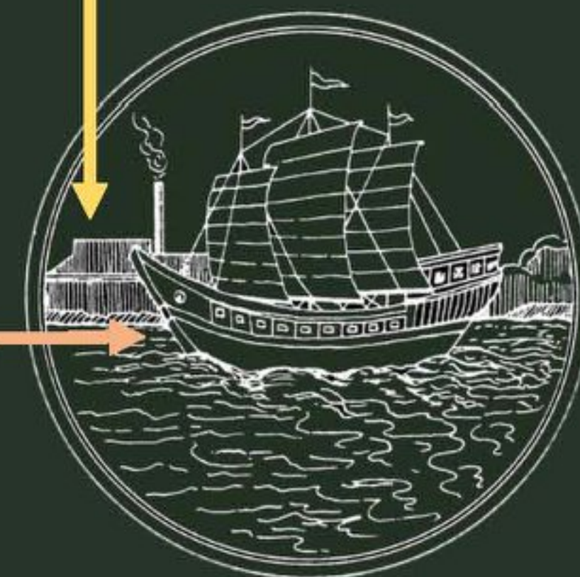
ตราประจำจังหวัดสมุทรสาคร

สมุทร แปลว่า ทะเล, สาคร แปลว่า ทะเลหรือแม่น้ำ รวมแล้วอาจจะหมายถึง ความเป็นเมืองแห่งทะเล, เมืองปากทะเลหรือเมืองท่าออกสู่ทะเลที่สำคัญ