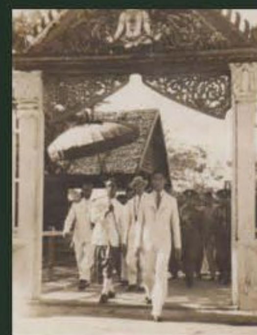
ภาพการเสด็จพระราชดำเนินวัดมหาชัยคล้ายนิมิตร (วัดใหม่) อ้างอิงภาพ : เพจ มหาชัย

20 พฤษภาคม พ.ศ.2489 ได้รับการจัดตั้งเป็นจังหวัดตามเดิม ประกอบด้วย 3 อำเภอ คือ อำเภอเมืองฯ อำเภอกระทุ่มแบน และ อำเภอบ้านแพ้ว ตรงกับวันที่พระบาทสมเด็จพระเจ้าอยู่หัวอานันทมหิดล (รัชกาลที่ 8) เสด็จพระราชดำเนินไปทรงเยี่ยมราษฎร ณ จังหวัด สมุทรสาคร เป็นการส่วนพระองค์