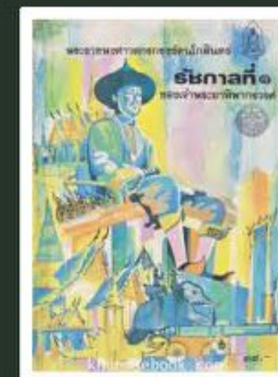
ภาพหนังสือพงศาวดารกรุงรัตนโกสินทร์ ฉบับเจ้าพระยาทิพากรวงศ์

สมัยพระบาทสมเด็จพระจอมเกล้าเจ้าอยู่หัว (รัชกาลที่ 4) ราว พ.ศ.2408 โปรดเกล้าฯ ให้ขุดคลองภาษีเจริญ และ ราว พ.ศ.2409 โปรดเกล้าฯ ให้ขุดคลองดำเนินสะดวก