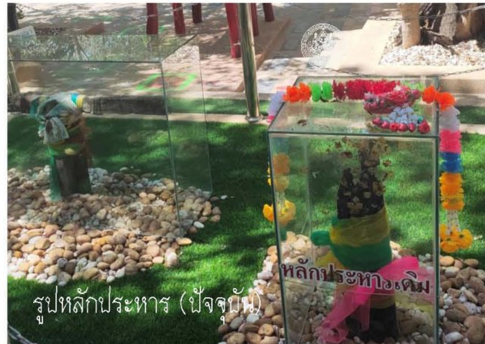
รูปหลักประหาร (ปัจจุบัน)