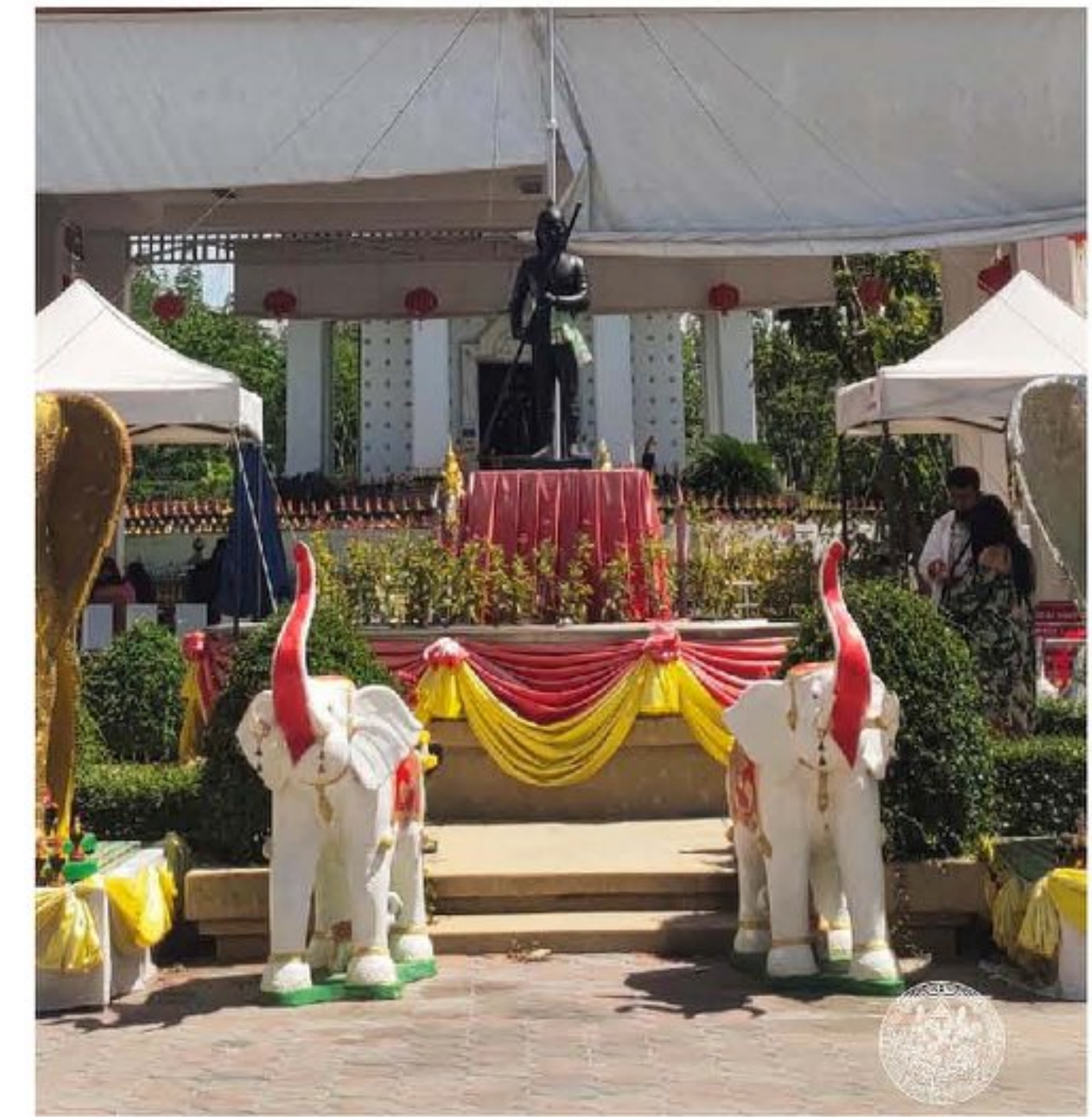
ประติมากรรมเจ้าพ่อพันท้าย (จำลอง)