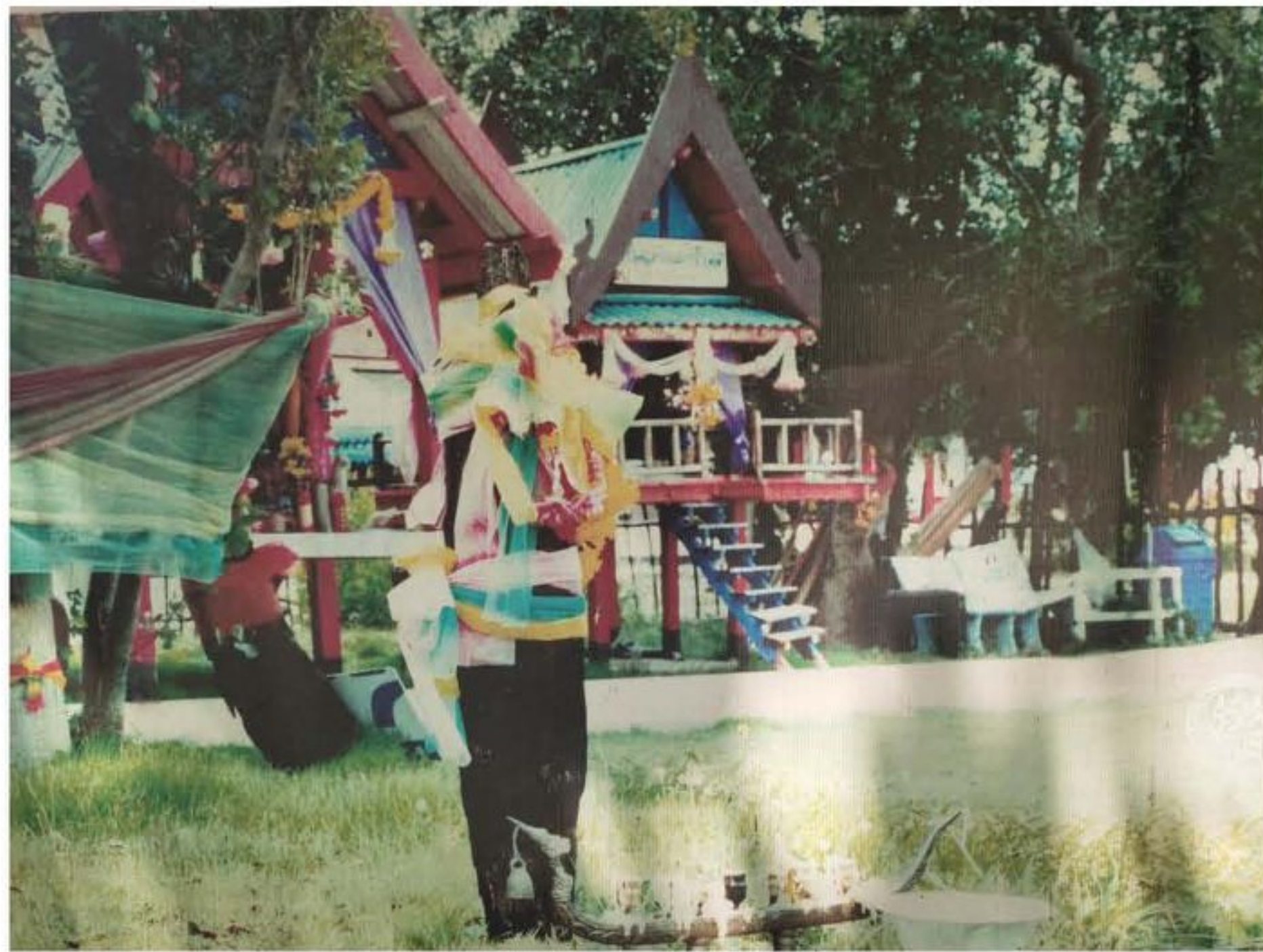
ศาลเตียม (หลังเก่า)