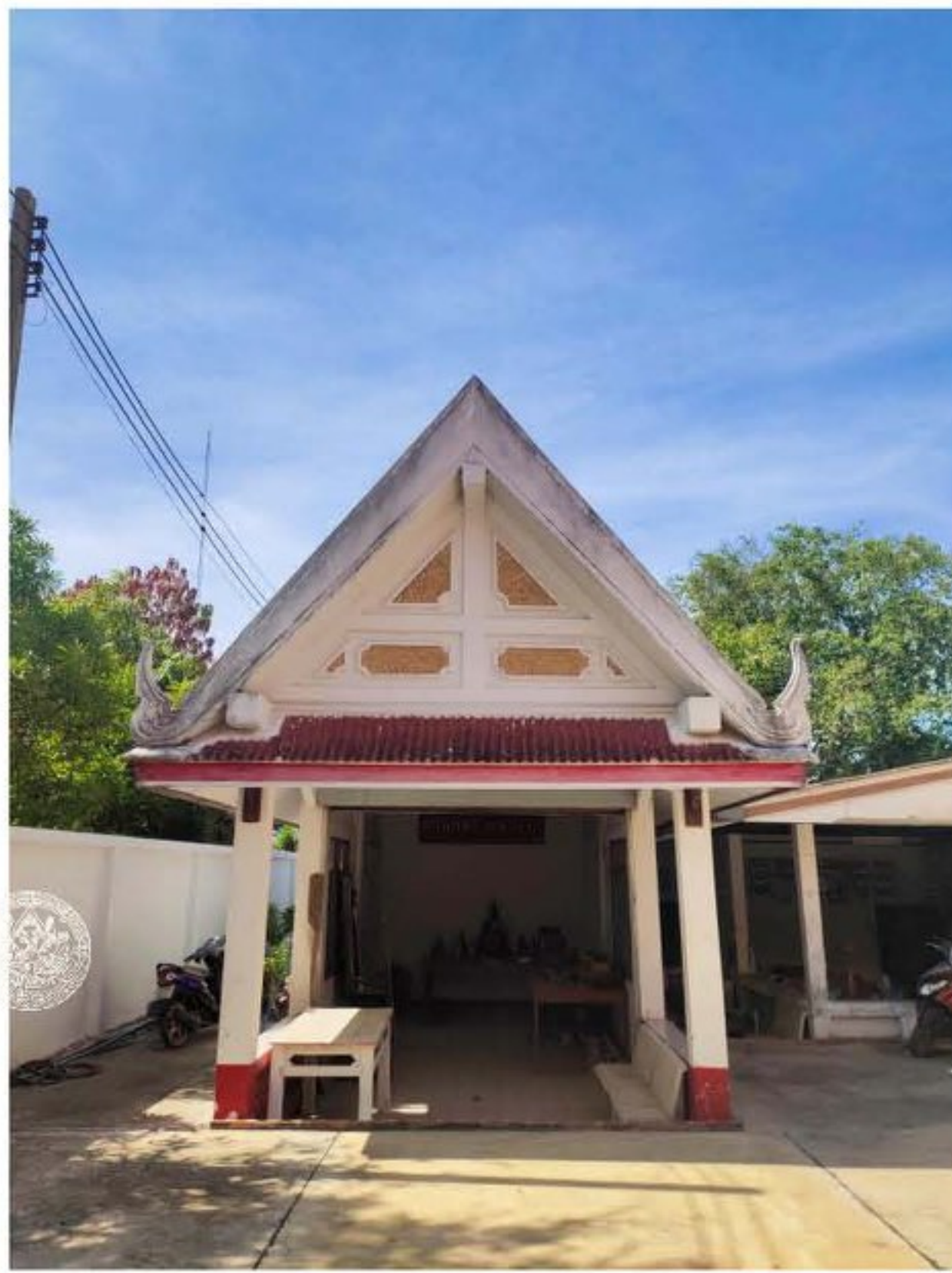
ศาลจำลอง หลังที่ ๒