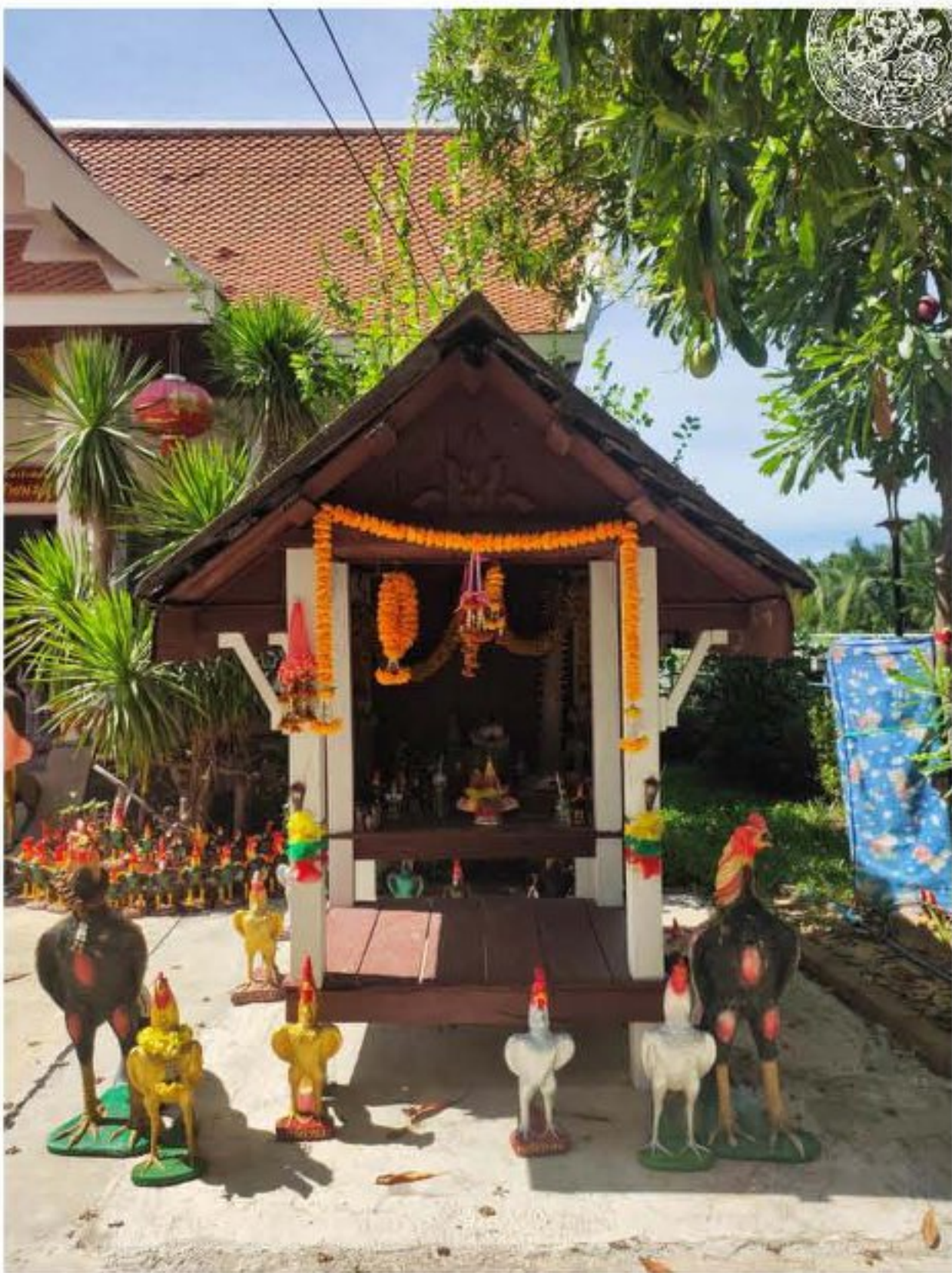
ศาลจำลอง หลังที่ ๑