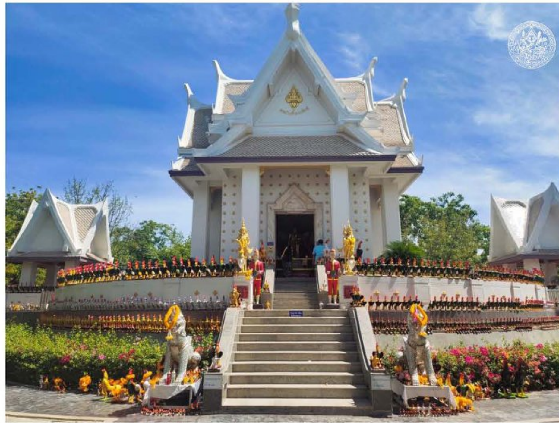
(ศาลเตียม หลังปัจจุบัน)