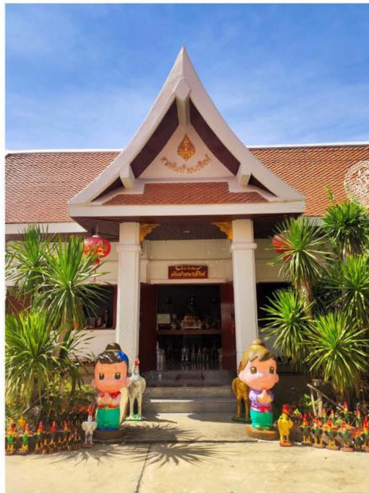
ศาลจำลอง หลังที่ ๓