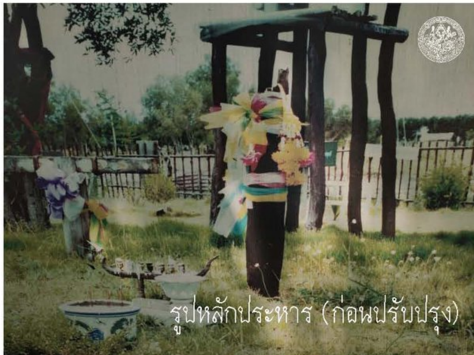
รูปหลักประหาร (ก่อนปรับปรุง)