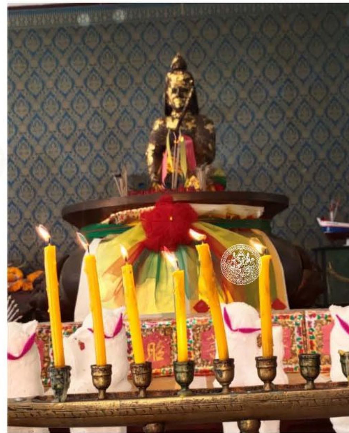
ประติมากรรมเจ้าพ่อพันท้าย