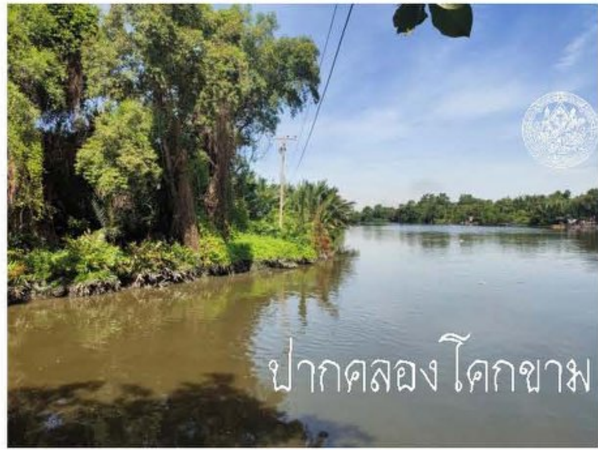
ปากคลองโคกขาม