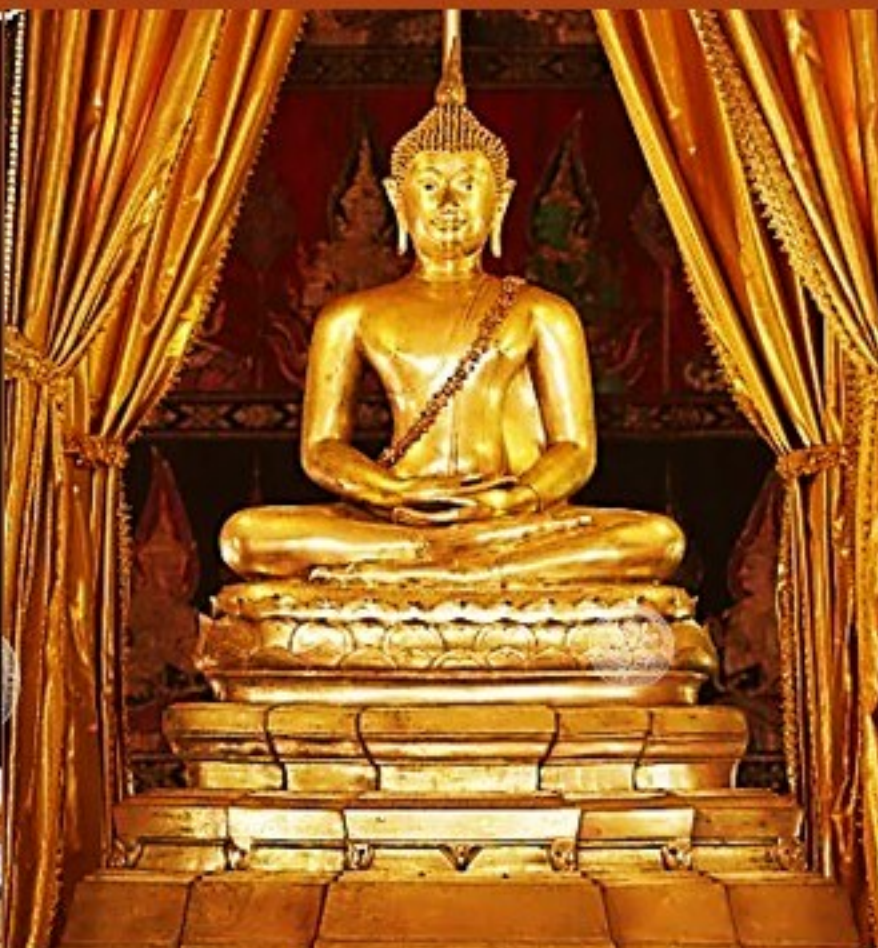
พระพุทธรูปสีหิงค์ พระที่นั่งพุทธไสสวรรคย์ พิพิธภัณฑสถานแห่งชาติ พระนคร กรุงเทพมหานคร