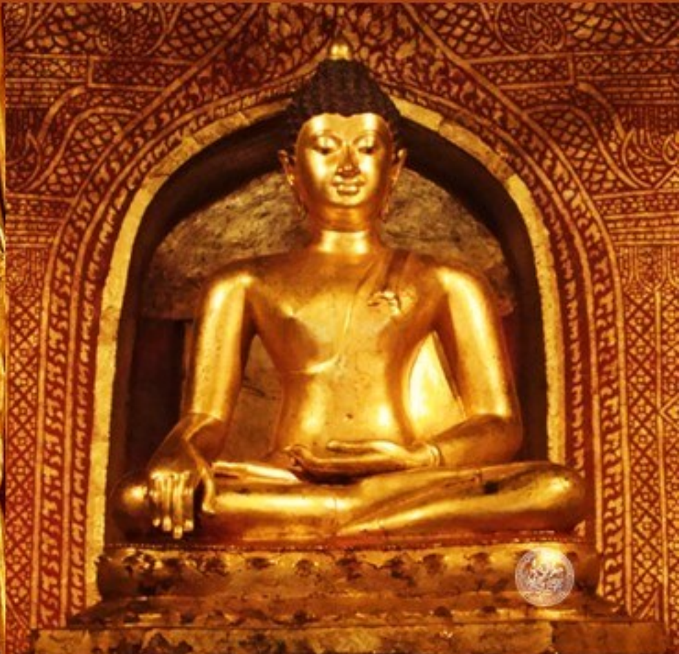
พระพุทธรูปสีหิงค์ (เชียงแสนสิงห์หนึ่ง) วัดพระสิงห์วรมหาวิหาร จ.เชียงใหม่

พุทธลักษณะพระพุทธรูปสีหิงคะ วัดโคกขาม มีความคล้ายพระพุทธรูปสีหิงค์ในศิลปะล้านนา หรือเรียกว่า “พระขอมตัม” ซึ่งเป็นความนิยมในสมัยอยุธยาตอนปลาย โดยมีข้อสันนิษฐานคือ ได้รับอิทธิพลด้านรูปแบบมาจากกรุงศรีอยุธยาโดยตรง หรืออีกข้อสันนิษฐานหนึ่งว่า ได้รับมาจากเมืองนครศรีธรรมราช