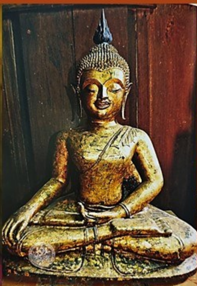
พระเชียงแสนขอมตัม วัดใหญ่สุวรรณาราม จ.เพชรบุรี