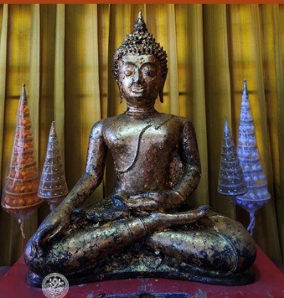
พระสีหิงคะ วัดโคกขาม จ.สมุทรสาคร