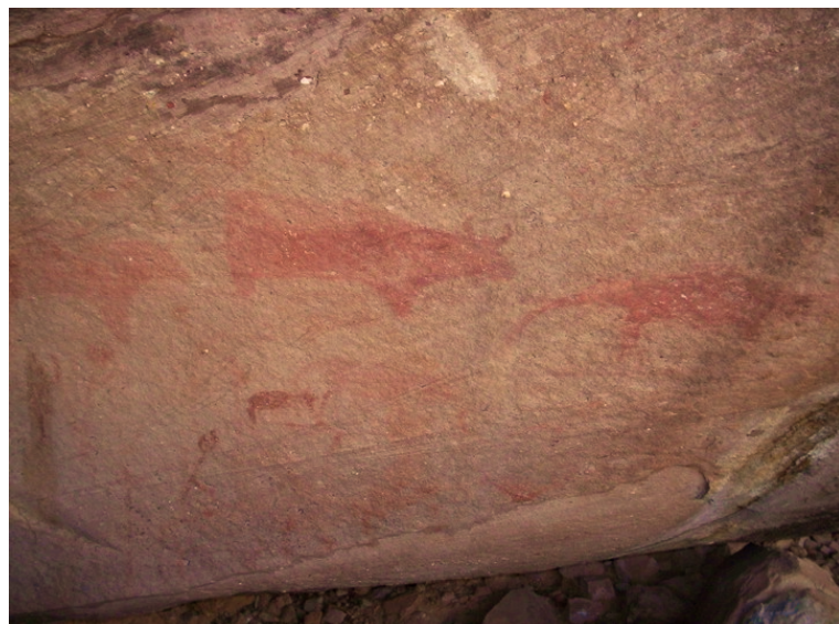
ภาพที่ ๓ ภาพเขียนสีรูปวัวจากถ้ำวัว-ถ้ำคน ตำบลเมืองพาน อำเภอบ้านฝาง จังหวัดอุดรธานี